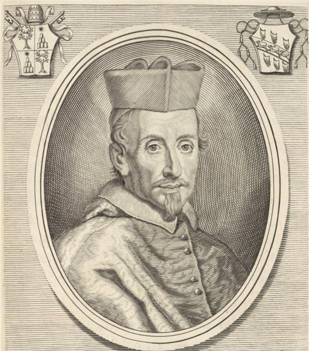
GREGORIVS S-R-E-PRESB. CARD. BARBADI- CVS. VENETVS. CREAT. DIE V. APRILIS. MDCLX.