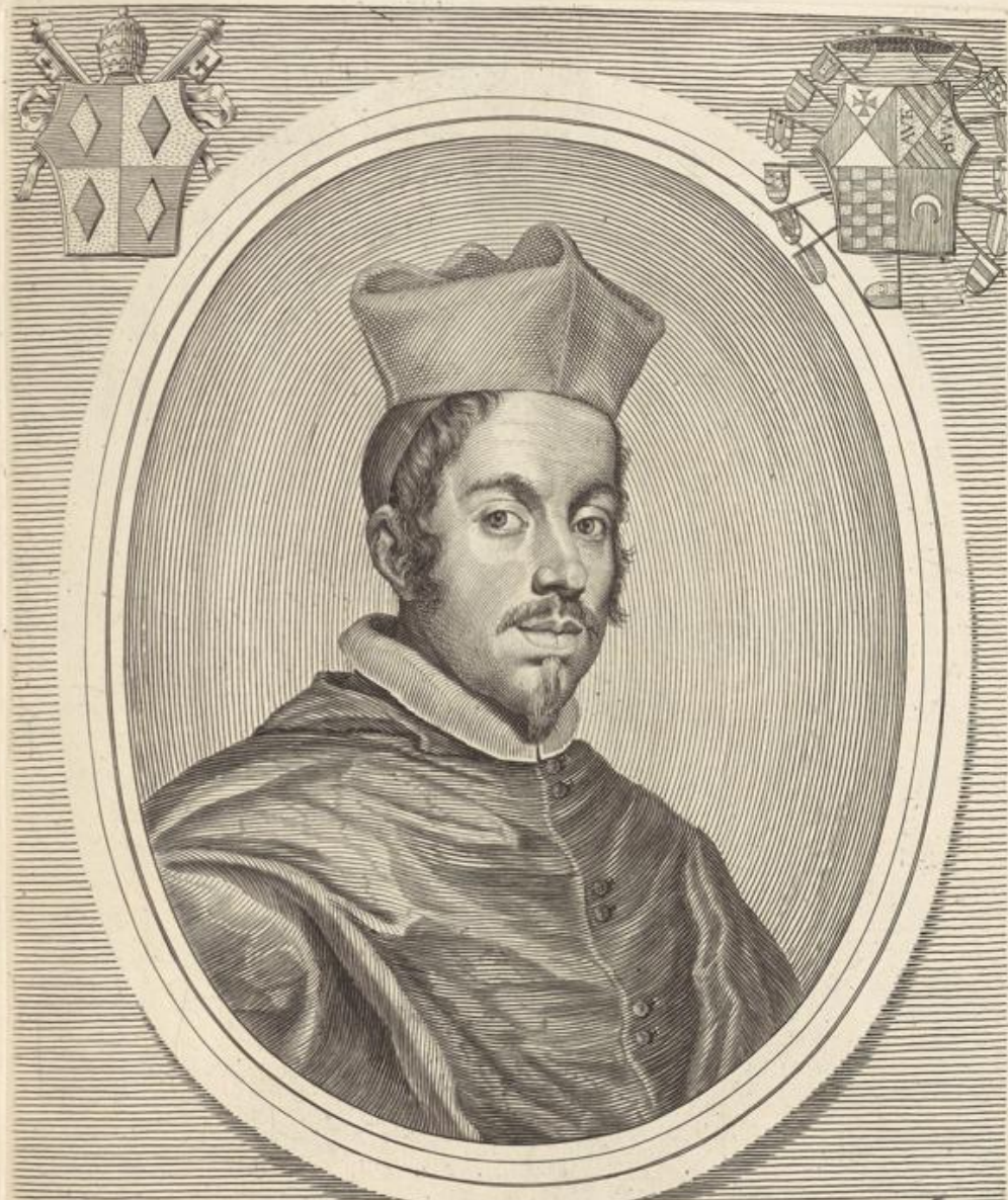
LVDOVICVS S.R.E.PRESB.CARD.DE PORTO CARRERO HISPANVS. V.AVGVSTI MD CLXIX.