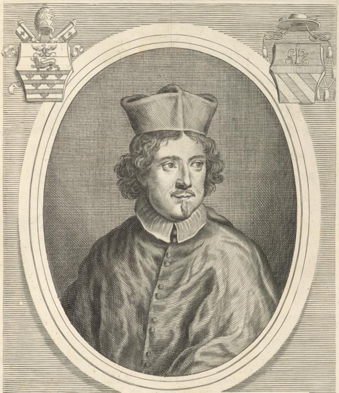
SAVVS S. R. E. PRESBYTER CARDINALIS MILLINVS ROMANVS CREATVS DIE I. SEPTEMBRIS MDCLXXXI.