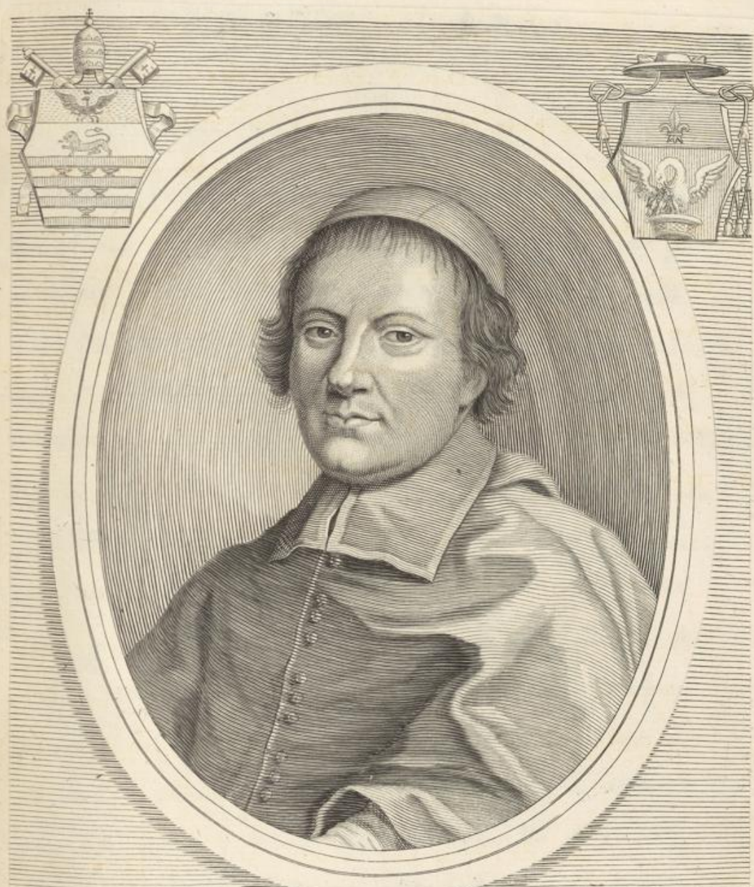
STEPHANVS S.R.E. PRESBYTER CARDINALIS LE CAMVS EPISCOPVS GRATIANOPOLITANVS GALLVS CREATVS DIE II. SEPTEMBRIS MDCLXXXVI