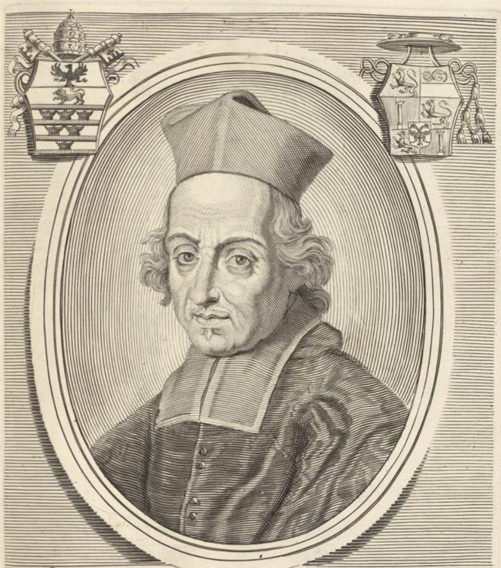
IOANNES S. R. E. PRESBYTER CARDINALIS GOESSEN GERMANVS CREATVS DIE II. SEPTEMBRIS MDCLXXXVI.

Io. Iacobus de Rubeis Formis Romæ ad Templum Pacis cum Priu. S. Pont.