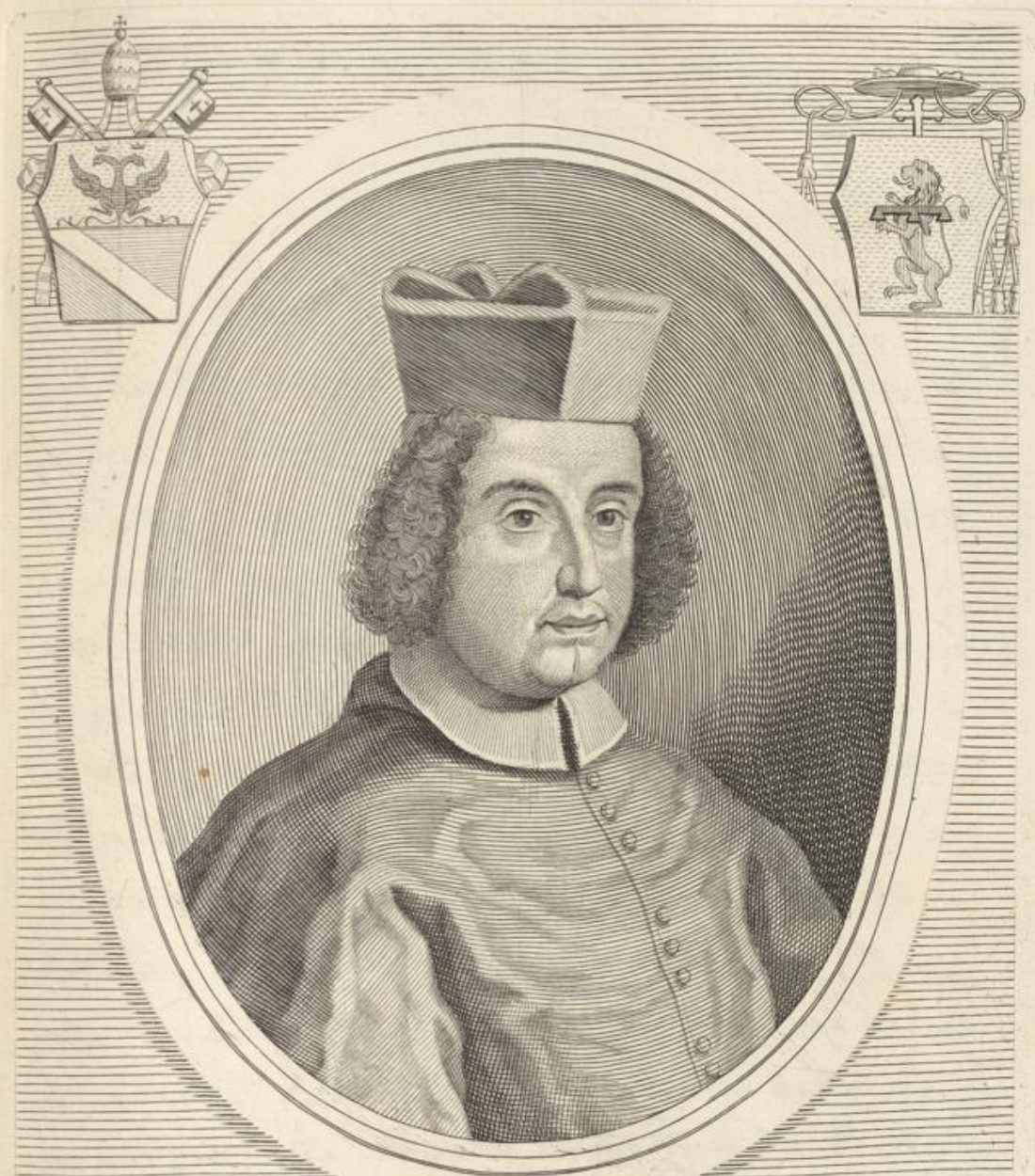
IACOBVS S.R.E. PRESBYTER CARDINALIS CANTELMVS NEAPOLITANVS CREATVS DIE XIII. FEBRVARII MDC.XC.