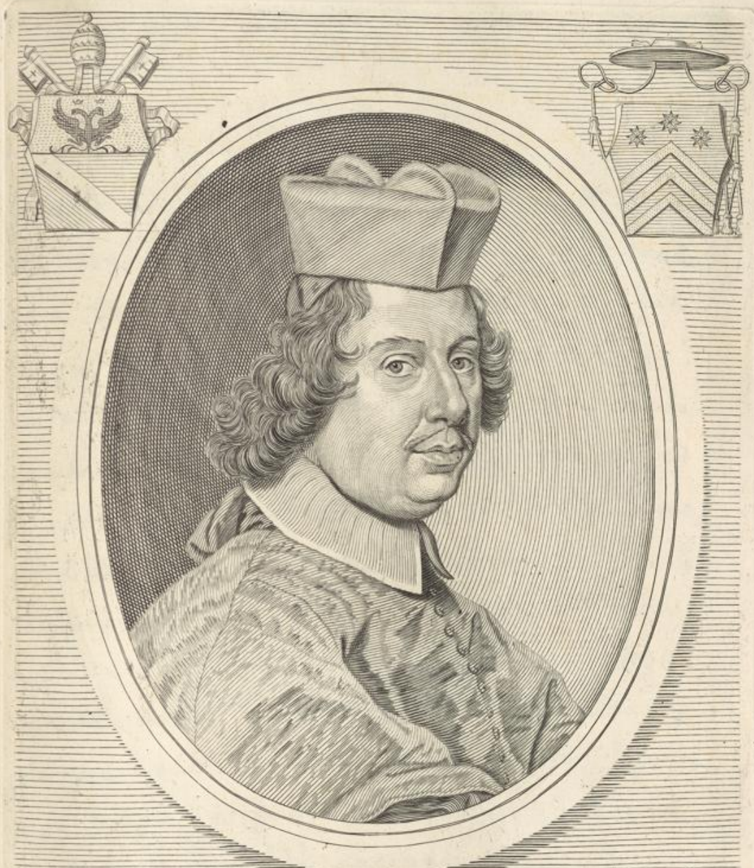
IOANNES BAPTISTA S.R.E. PRESBYTER CARDINALIS COSTAGVTVS ROMANVS CREATVS DIE XIII. FEBRVARII MDC.XC.