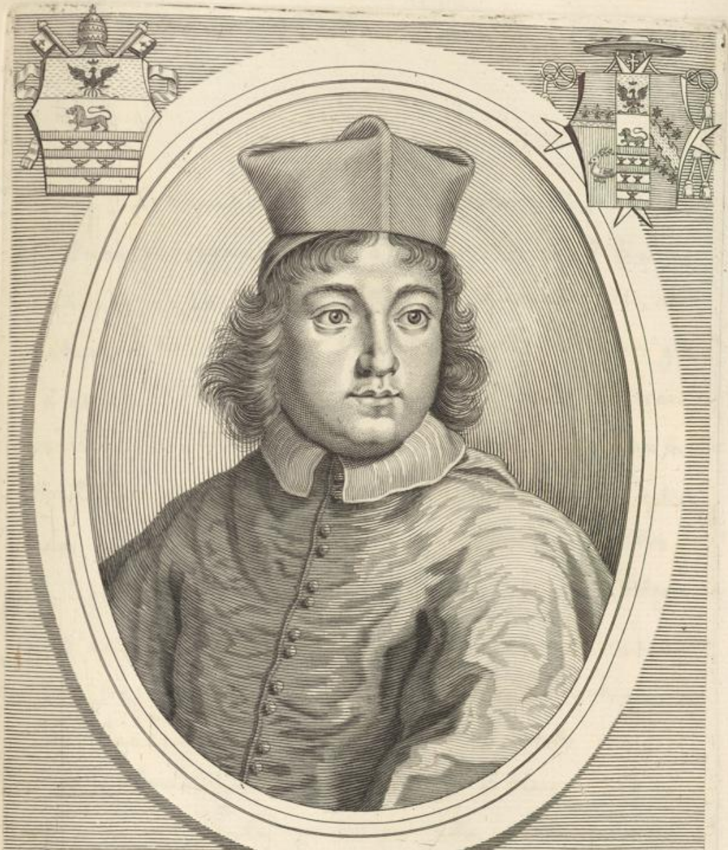
BENEDICTVS S.R.E. DIACONVS CARD. PAMPHILIVS ROMANVS CREATVS DIE I. SEPTEMBR. MDCLXXXI.