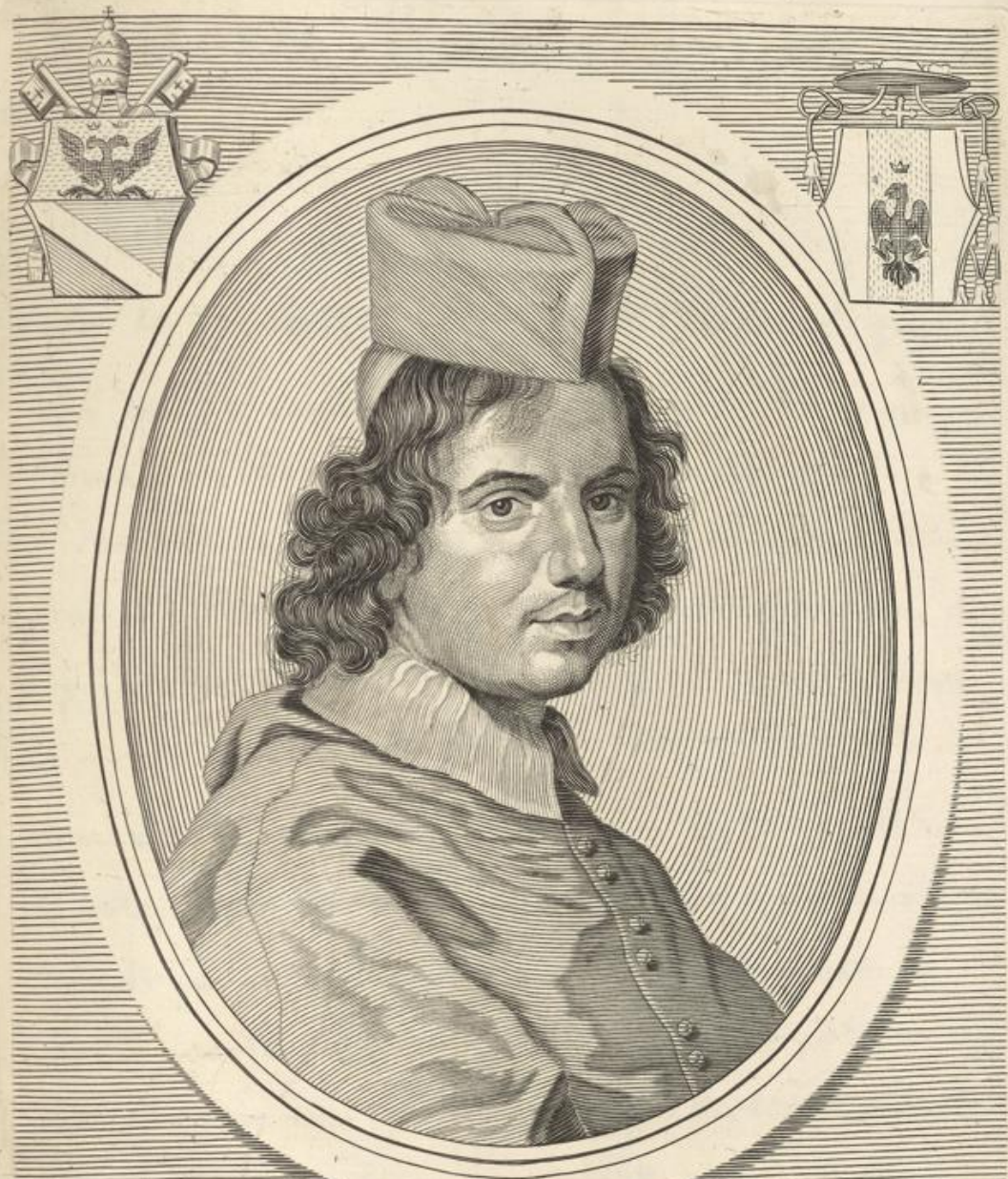
IOSEPH RENATVS S. R. E. DIACONVS CARDINALIS IMPERIALIS IANVENSIS CREATVS DIE XIII. FEBRVARII MDC.XC.

Io. Iacobus de Rubeis Formis Romæ ad Templum Pasæ cum Pruil. S. P.