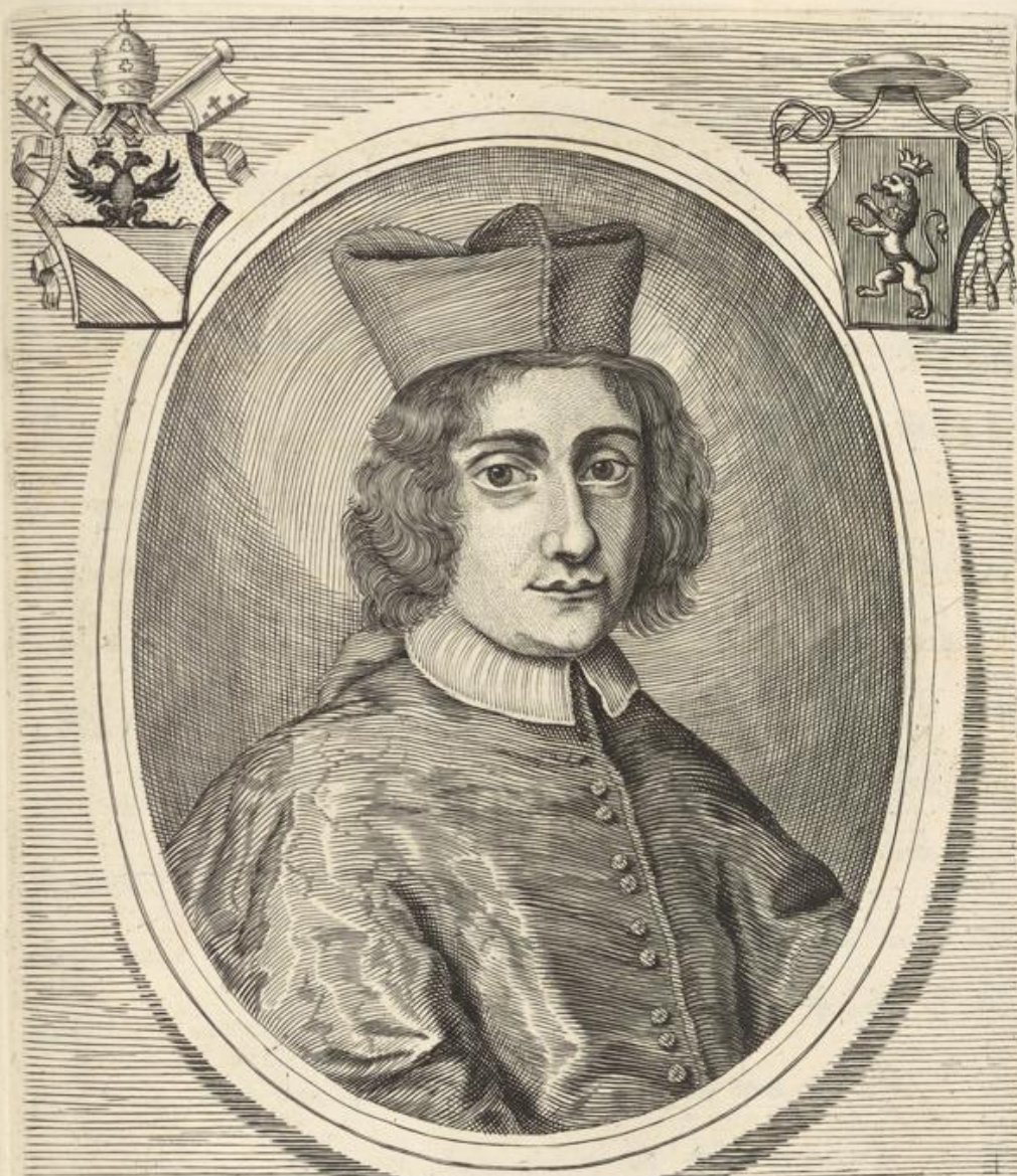
ALOYSIVS S. R. E. DIACONVS CARDINALIS HOMODEVS MEDIOLANENSIS CREATVS DIE XIII. FEBRVARII M. DC. XC.