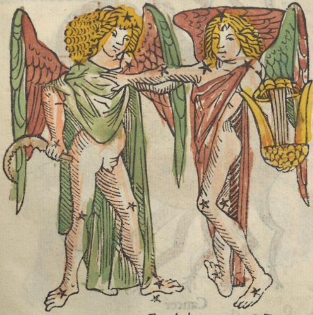
Gemini e z

G emini ab aurige parte dextra supra orionē collo- cati uidentur: ita tñ ut orion inter taurū & geminos sit cōstitutus: capita eorū diuidunt a reliquo cor- pore: circulo eo qui estiuū diffinire supra est dict⁹. Ita ut cōplexa corpa inter se tenētes. Occidāt di- recti a pedib⁹. Exoriunt autē inclinati ut iacētes. Sed is q can- cro est pximus. habet in capite stellā unā clarā. In utrisq; hume- ris singulas claras. In dextro cubito unā. In genib⁹ utrisq; singu- las. In pedib⁹ utrisq; singulas. Alter autē i capite unā. In sinistro humero unam. In dextro alterā. In utrisq; manibus singulas. In dextro genu unā. In sinistro genu alterā. In pedibus utrisq; sin- las & intra sinistrū pedē unā quę tropus appellat. & sūt. xviii.