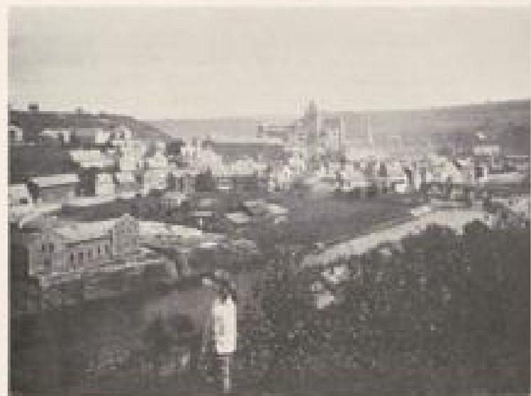
DECK, VOM ST. PETER

und die Tremlose erwiderte seine stürmischen Bewerbungen mit gleichen Zärtlichkeiten. Dem getäuschten Herzen aber ahnte nichts Böses. Endlich eines Abends, als seine Geliebte ihn vorgeblich hatte harren lassen, schlich er sich heimlich zur Mühle und belauschte das eintvergessene Paar. Gebrochenen Herzens kehrte er zum Flusse zurück. Als er nun so verzweifelt im Kahne sass, kam der junge Edelmann von seinem nächtlichen Besuche zurück und rief dem Fährmann zu, er solle ihn hinüber nach Lahneck rudern; und als der arme Getäuschte willendlos gehorchte und mit eifrigen Ruderschlägen den leichten Kahn durch die nächtliche Dunkelheit führte, da erzählte herzlos und prahlerisch der Burgherr von der schönen Müllerin, die