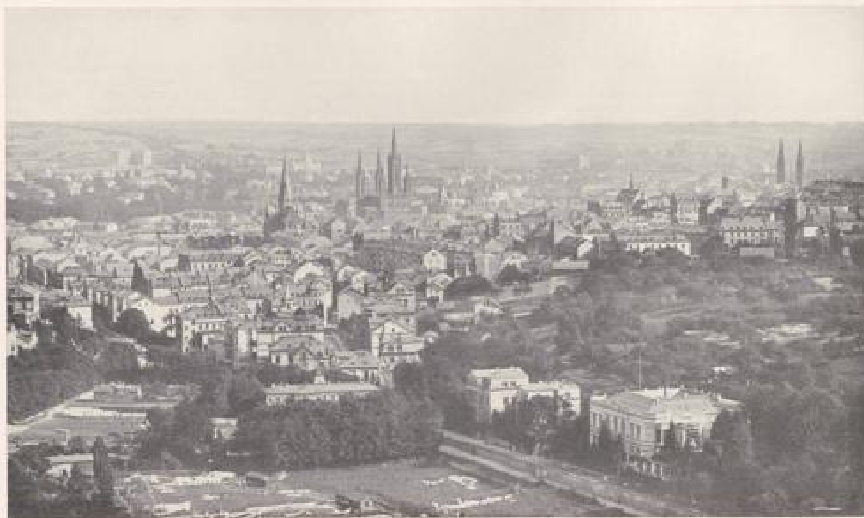
PANORAMA VOM NEROBERG