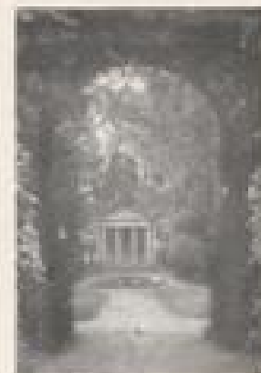
MINERVA-TEMPEL SCHLOSSGARTEN SCHWETZINGEN