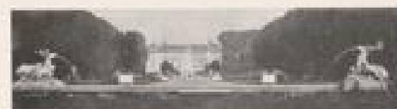
HAUPTSTRASSEN UND SCHLOSS