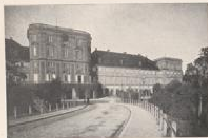
DAS SCHLOSS IN MANNHEIM