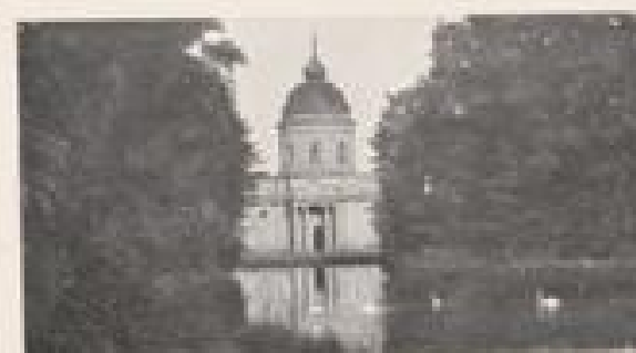
DIE MOSCHEE MIT TEICHBASSIN