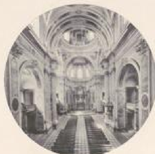
JESUITENKIRCHE (INNEN), MANNHEIM