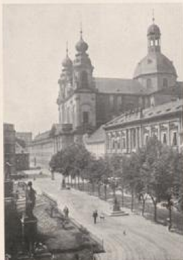
THEATERPLATZ UND JESUITENKIRCHE, MANNHEIM