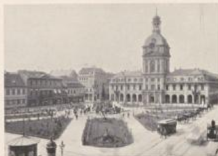
PARADEPLATZ UND KAUFHAUS, MANNHEIM