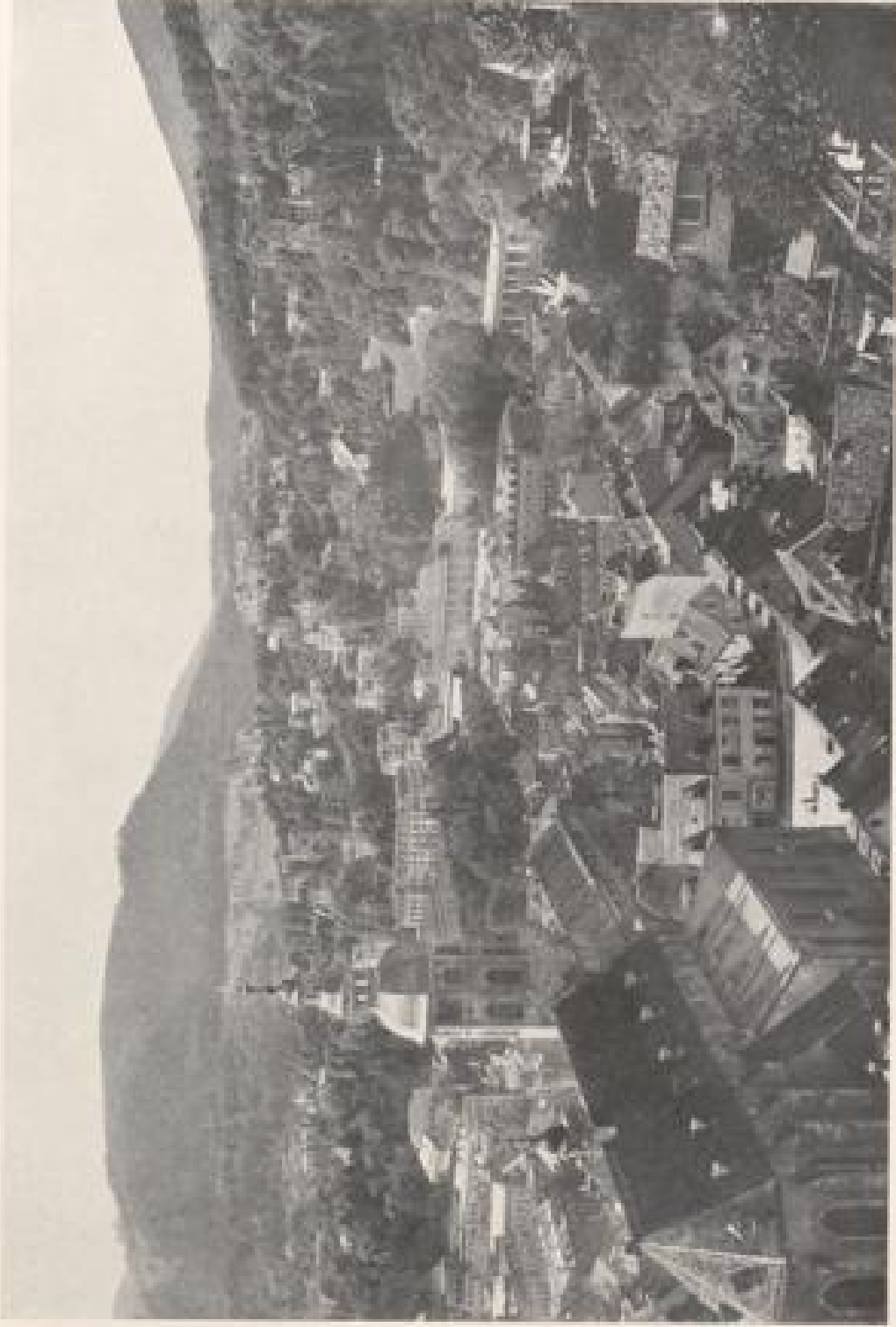
BADENBADEN. VOM STIEGEN-SCHLOSS