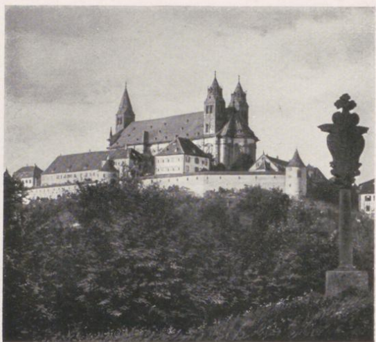
Abbazia di Grosskornburg, presso Schwäb. Hall

di un'alta collina), Neuenstein e Oehringen , con notevoli ed antichi castelli dei principi di Hohenlohe; queste cittadine formano il cosiddetto «Malerwinkel» (angolo dei pittori) e sono molto frequentate.