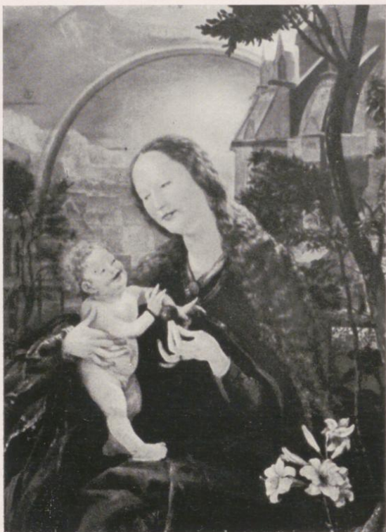
Stuppach, presso Bad Mergentheim: quadro d'altare di Grünewald

con la sontuosa e molto rinomata sala dei ricevimenti, del XVI–XVII. Secolo. Occasioni per esercitare lo sport e la pesca alla lenza,