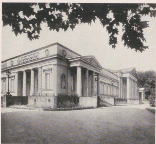
Schloss Rosenstein, presso Stoccarda

quanto mai vario e leggiadro. Nel centro dell'Unterland è situato anche il territorio industriale propriamente detto, una delle regioni più popolate ed animate della Germania e soprattutto la capitale del Württemberg.