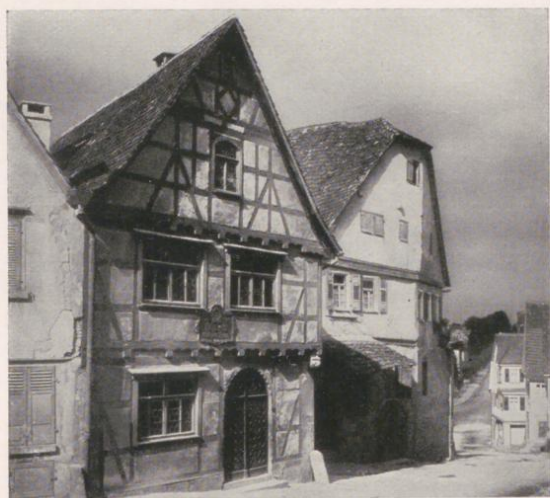
Marbach, Casa natale di Schiller

sculture tedesche in legno; gabinetto di antichità con vasi romani.