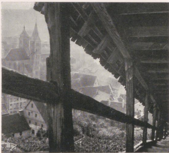
Esslingen, galleria di difesa

Musei e Collezioni: Collezione archeologica di Stato nella Landesbibliothek (Biblioteca regionale: 705,800 volumi, 5,800 manoscritti, 8,300 bibbie in più di 100 lingue, 4,600 incunaboli); Deutsches Auslandsinstitut nella Casa del Germanesimo (Haus des Deutschtums); Museo dell'Aeronautica nel Wilhelmopalast (Zeppelinsammlung); Landesgewerbemuseum (celebri collezioni d'arte industriale, riparto: Aberrazioni del gusto ecc.); Lindenmuseum für Länder- und Völkerkunde (Museo di geografia ed etnografia); Museum der bildenden Künste (Museo di Belle Arti); Staatsarchiv (Archivio di Stato); Württembergische Naturaliensammlung (Museo di storia naturale); Gabinetto archeologico nell'Alten Schloss; Schloss- und Heeresmuseum im Neuen Schloss; Galleria di quadri nell'ex-Kronprinzenpalais; Galleria Municipale di quadri in Berg; Biblioteca della guerra mondiale nello Schloss Rosenstein; Staatliches Ausstellungsgebäude (edificio statale per esposizioni).