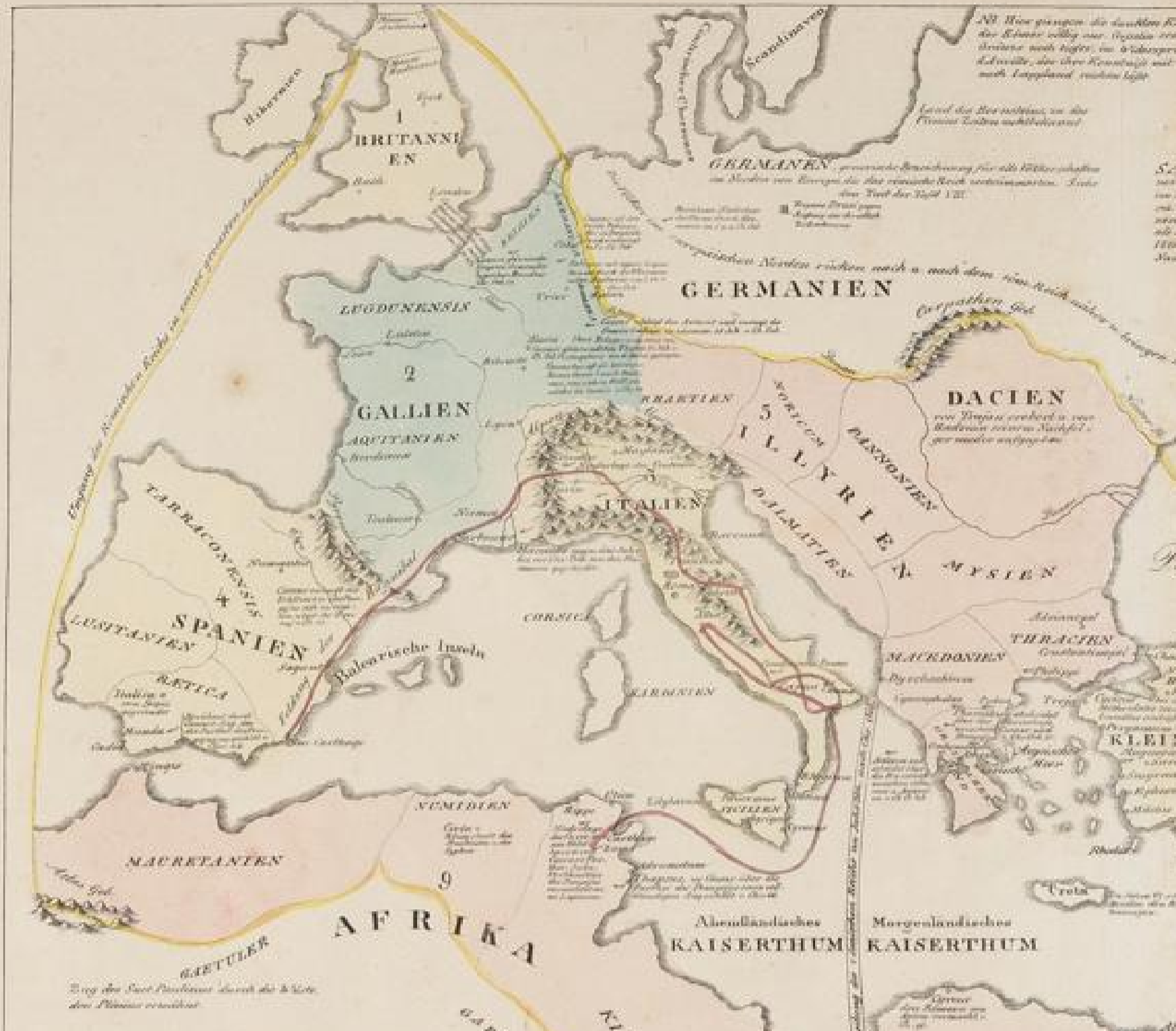
GEMÄLDE des RÖMISCHEN REICHS in seiner größten Ausdehnung. Seine Provinzen, ihre Untertheilungen, die Orte wo berühmte Schlachten vorgefallen, seine Theilung in morgenländisches und abendliches Reich.

ROM VON DEN KÄISERN; Zeitraum von 500 Jahren. In dieser Zeit erlebte die römische Republik, deren Geschichte in doppelter Beziehung nach anmerkenswerten Begebenheiten ist. Nach Romulus, dem ersten Kaiser, folgte Numa, dann Tullius, die beiden letzten Kaiser.