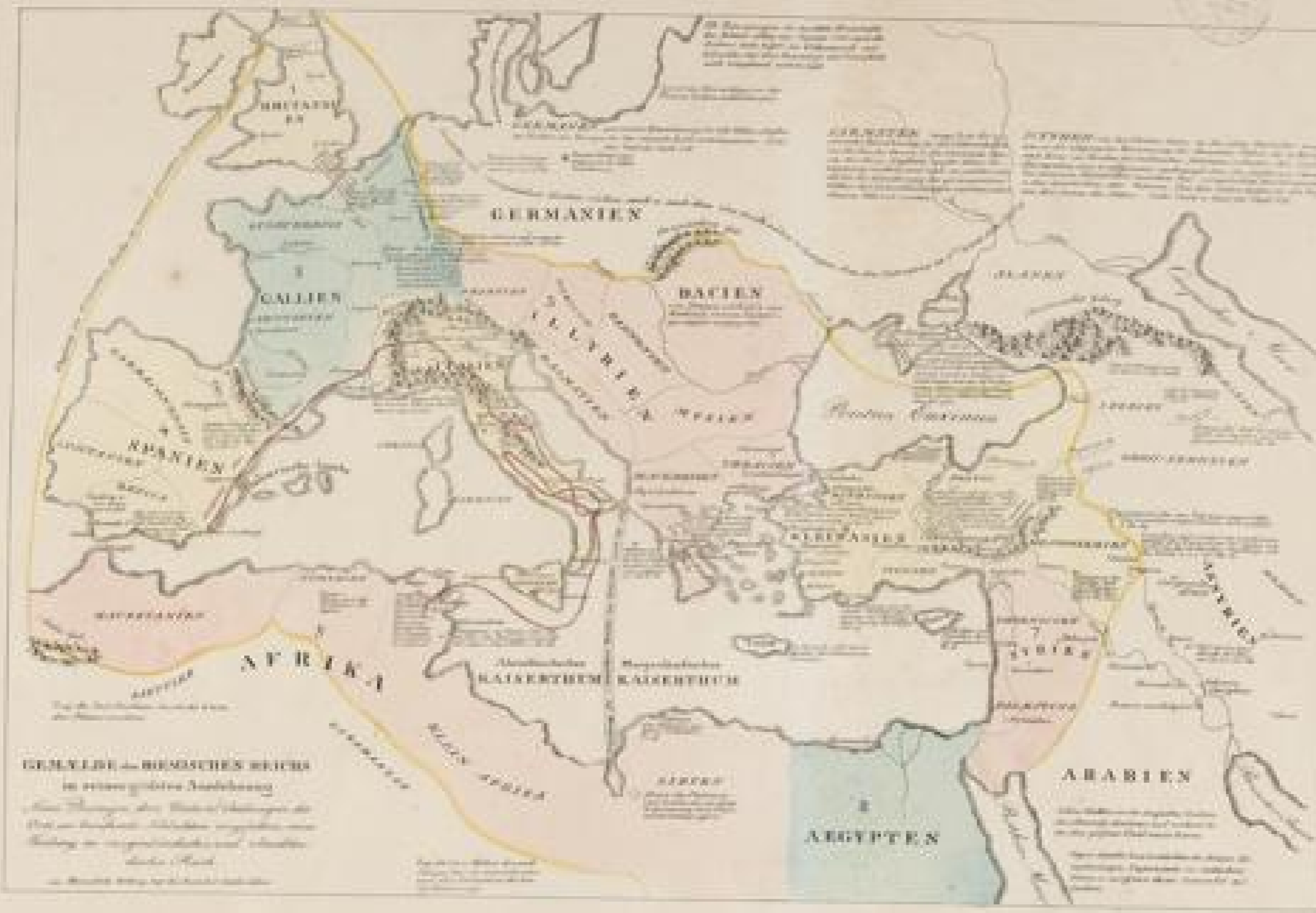
GEMEINDE- u. RÖMISCHES REICH in seiner größten Ausdehnung nach Tacitus, des Römischen Reichs Beschreibung in seiner größten Ausdehnung nach Tacitus, des Römischen Reichs Beschreibung in seiner größten Ausdehnung

Die Karte zeigt die römischen Provinzen und ihre Unterteilungen. Die Provinzen sind farblich markiert und mit lateinischen Namen beschriftet. Die Karte ist von einer gelben Linie umrandet, die die Grenzen des römischen Reichs darstellt.