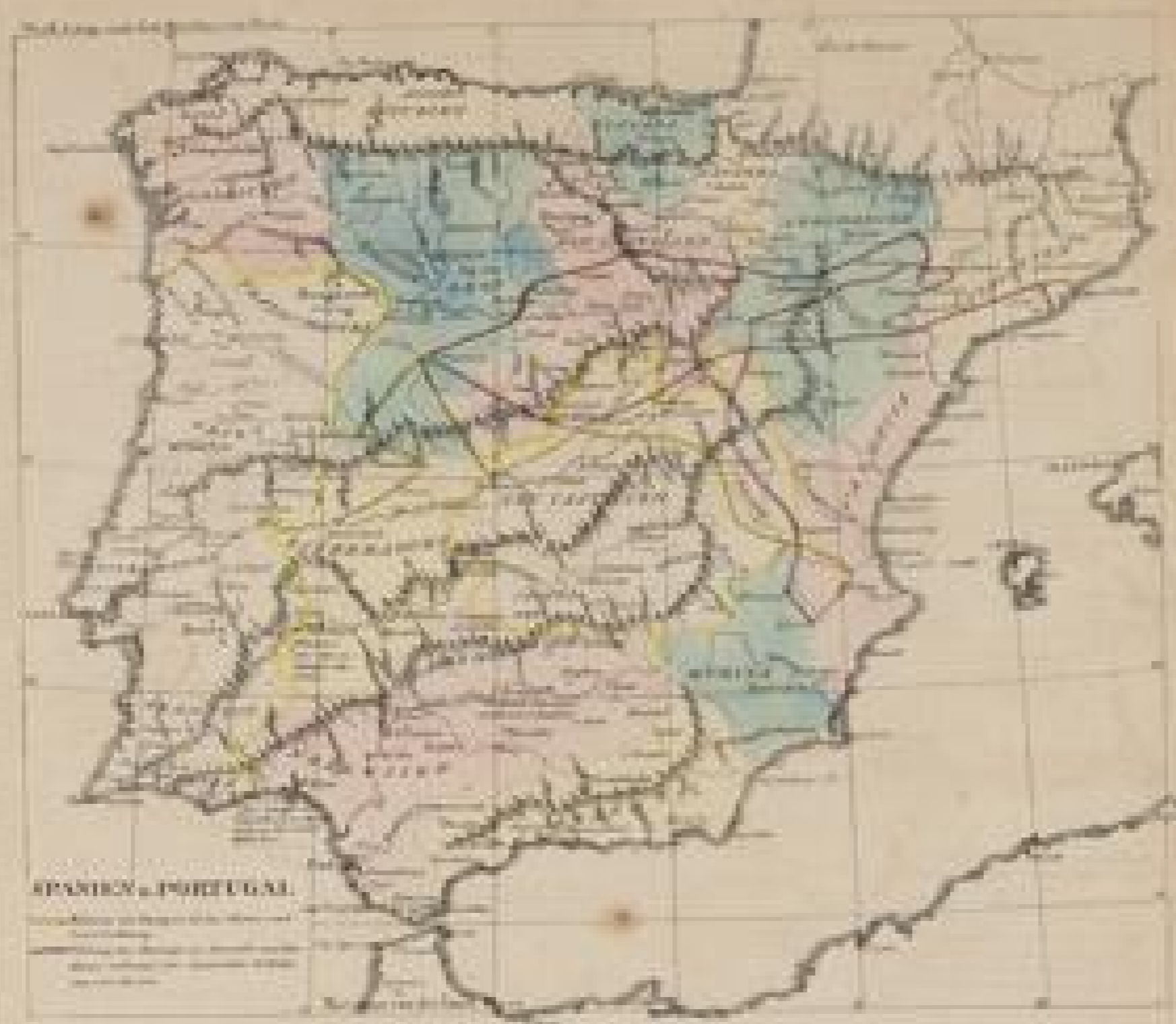
PHYSIKALISCHES VERHALTEN VON SPANIEN UND PORTUGAL

Die Iberische Halbinsel ist ein Teil der Eurasischen Platte. Sie ist durch die Pyrenäen von Frankreich getrennt, durch die Straße von Gibraltar von Afrika und durch den Atlantik von Amerika. Die Iberische Halbinsel ist ein Teil der Eurasischen Platte.