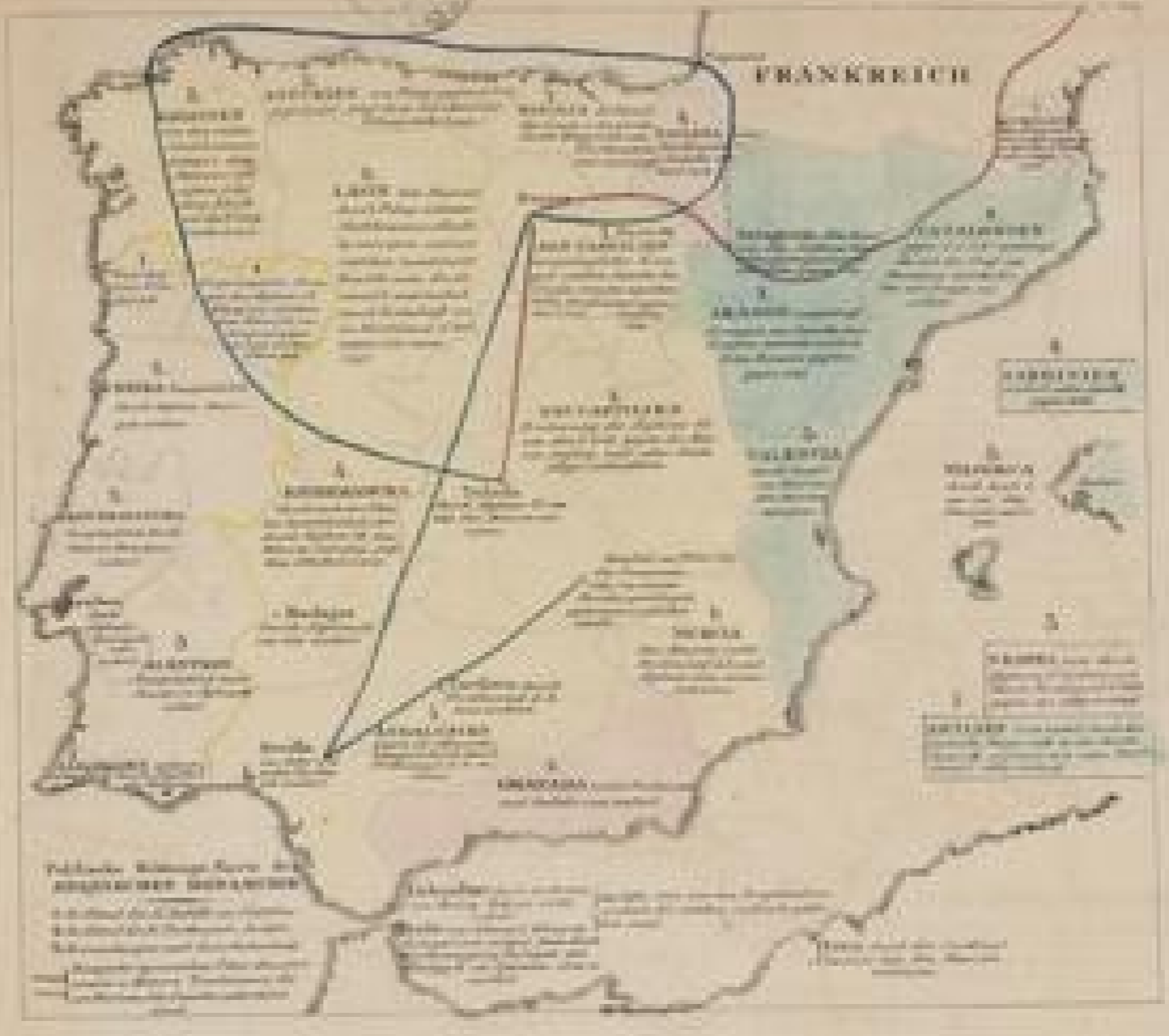
POLITISCHES VERHALTEN VON SPANIEN UND PORTUGAL

Die Iberische Halbinsel ist ein Teil der Eurasischen Platte. Sie ist durch die Pyrenäen von Frankreich getrennt, durch die Straße von Gibraltar von Afrika und durch den Atlantik von Amerika. Die Iberische Halbinsel ist ein Teil der Eurasischen Platte.