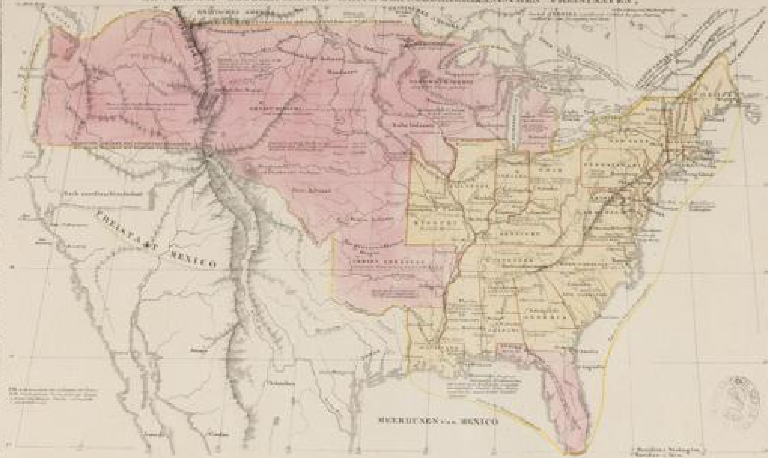
Physiognomische Uebersicht der vier und unzeitig Unionsstaaten Nordamerikas; Bevölkerung, Oberfläche, Fortsetzung etc.