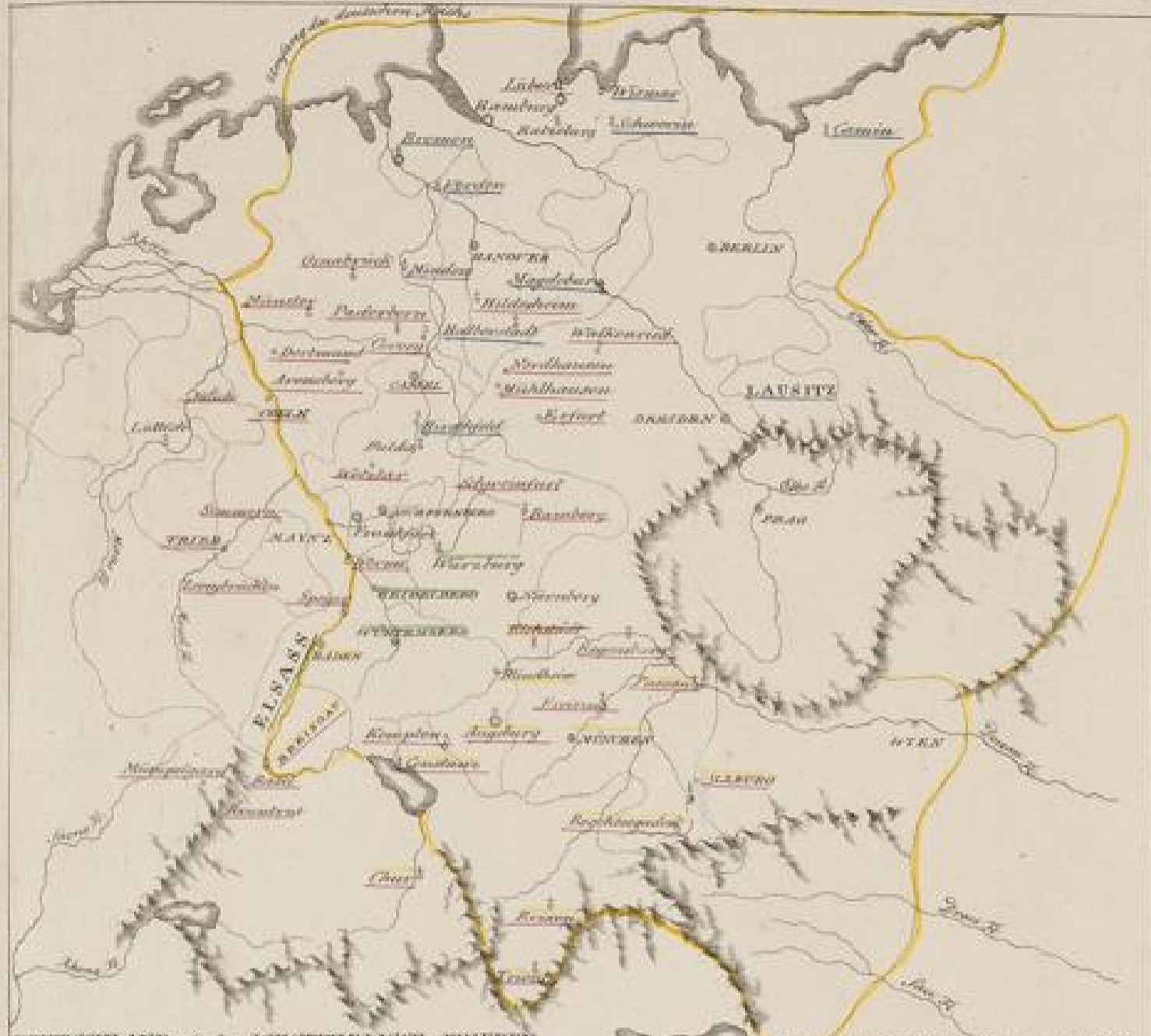
DEUTSCHLAND seit dem WESTPHÄLISCHEN FRIEDEN. Die Westphälischen Friedensverträge sind durch die Westphälischen Friedensverträge ersetzt. Die Westphälischen Friedensverträge sind durch die Westphälischen Friedensverträge ersetzt.

Fortsetzung der Geschichte des Deutschen Reichs und Kaiserthums. Der Reichstag wurde mit einer neuen Pländerung besetzt. Der Reichstag, der die englische Domäne in ihrer Epoche darbot, war schwebend. Seine Oberhälfte blieb gleichsam ungenutzt, und nur die Hälfte des Reichs bis an die Grenzen Italiens lag allen in Schutt und Asche, und das Schicksal war, dass auch die große Reichsversammlung, die die Reichsversammlung der Kaiserthums besetzte, in der Reichsversammlung der Kaiserthums besetzt wurde.