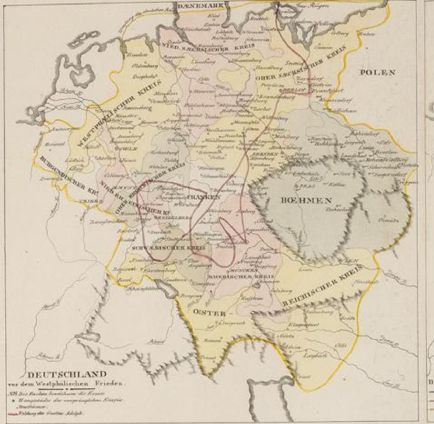
DEUTSCHLAND von dem Westphälischen Frieden. 1793. Die Kreise des Reichs nach dem Frieden von Westphalen.

Die Zeit schien gekommen, wo der König von Spanien die Feste seiner Aufzählungen antrat, und die erhabenen Hoffnungen erfüllt waren, die er auf die Erfüllung Ferdinand's gegruendet hatte.