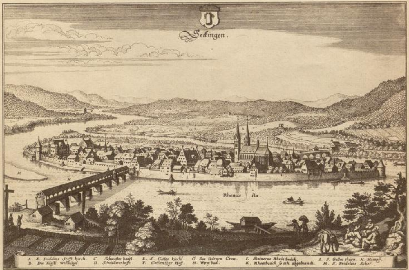
A. S. Fridelins Städt kirch. C. Schwester haus. E. S. Gallen küchl. G. Zu Dörren Cron. I. Steinern Rhein brück. L. S. Gallen thurn. N. Mümpff. B. Die Küchl. Wollwange. D. Schwaiber hufe. F. Contenther Hof. H. Wren bad. K. Rheinbrück so sek abgehauet. M. S. Fridelins Acker.