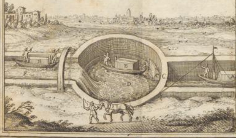
Abbildung der Schleußen auff dem Fluß Brenta.

A. Herauff fahrende Schiffe, B. Hinabfahrende Schiffe, C. Hier wirts zugegeschlossen, so füllt sich die Schleuße D. und erhebt das Schiffe E. das es dem Fluß F. gleich steht und also forthin fehret.