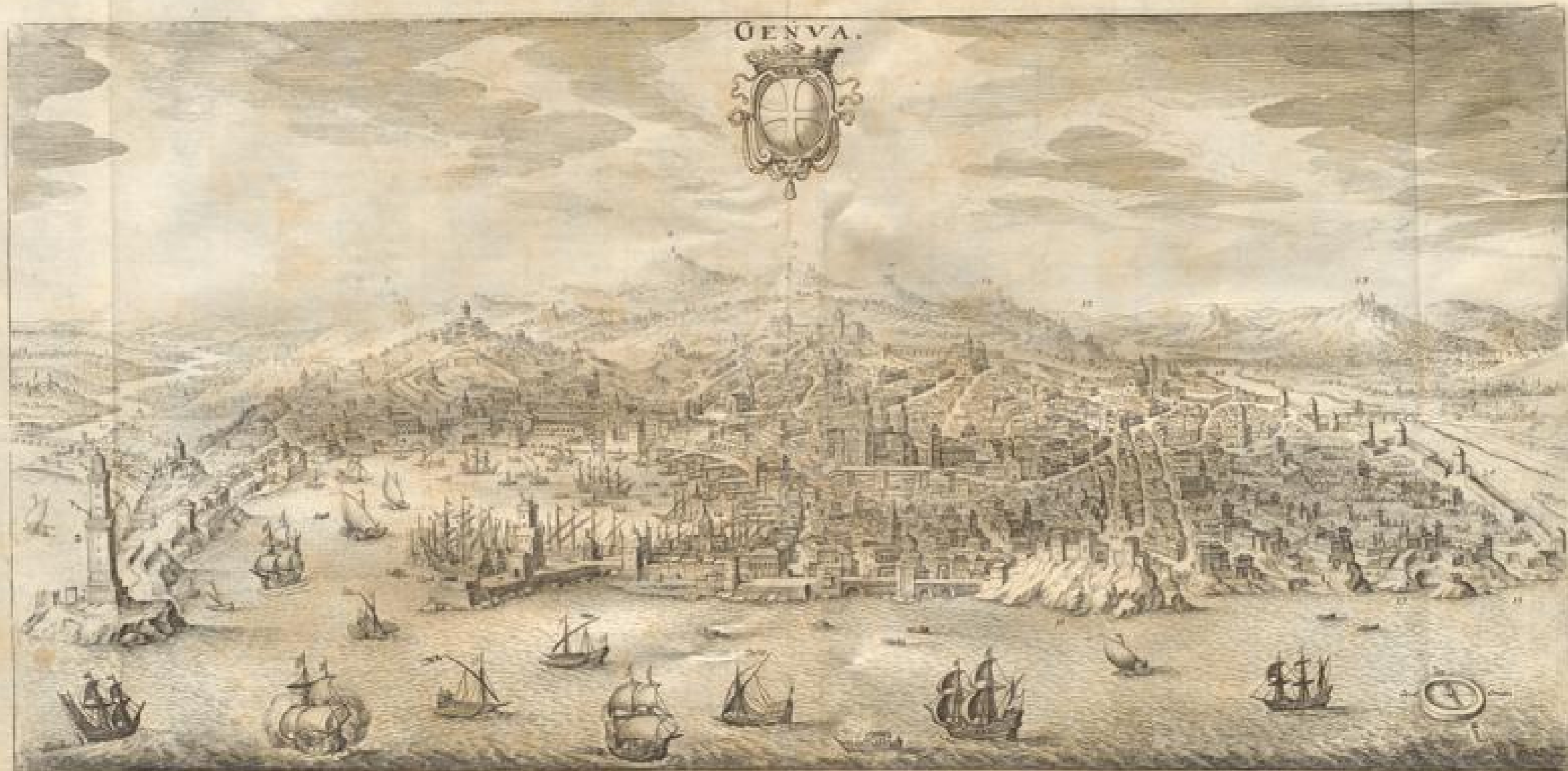
1. Il Faro di Amis 4. Palazzo d'Antonia Donna 7. Il Molo 10. La Pigna 13. Castello 16. Spina 19. Ala Ferra 22. La piazza de S. Spirito 2. La Lanterna 5. La Porta de S. Tomaso 8. La Dogia 11. S. Lorenzo 14. S. Marco 17. La Canea 20. Palazzo ferra 23. Chiesa Donna del Monte 3. La Chiesa de S. Giovanni 6. Il Arcivescovo 9. Il Castello 12. S. Bartolomeo d'ora 15. La Chiesa Donna del Spirito 18. Villa 21. S. S. S. 24. Chiesa de S. Spirito