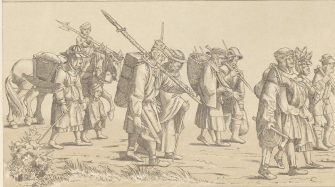
Messias et Gaulard del.