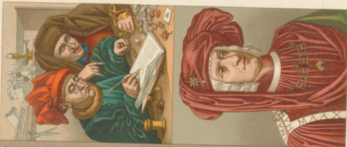
Imp. Firmin Didot, C o Paris