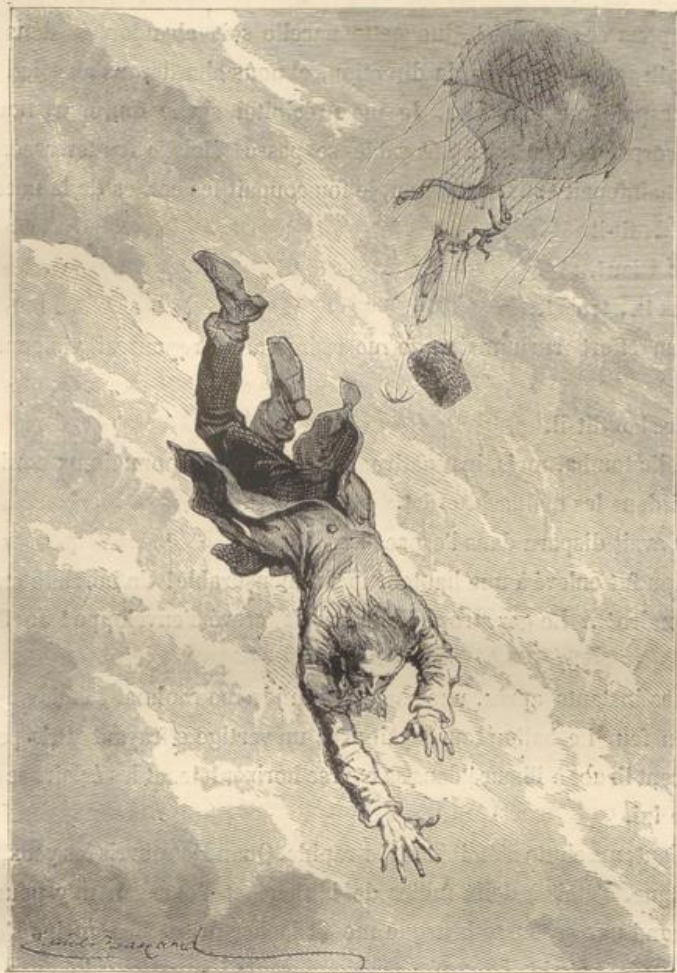
Le fou avait disparu dans l'espace! (Page 122.)

« Et en présence de ces faits, nous hésiterions encore ! Non ! Plus nous irons haut, plus la mort sera glorieuse ! »