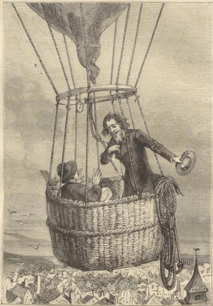
« Monsieur, je vous salue bien! me dit-il... (Page 103.)

leux. Tout entier à l'étonnement que lui procurait cette ascension silencieuse, il demeurait immobile, cherchant à distinguer les objets qui se confondaient dans un vague ensemble.