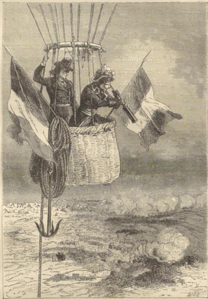
Il resta sept ou huit heures en observation... (Page 112.)

la face s'animaient de plus en plus. C'est à cette bataille que Coutelle, par l'ordre du gouvernement, organisa une compagnie d'aérostiers! Au siège de Maubeuge, le général Jourdan retira de tels services de ce nouveau mode d'observation, que deux fois par jour, et avec le général lui-même, Coutelle s'élevait dans les airs. La correspondance entre l'aéronaute et les aérostiers qui retenaient le ballon s'opérait au moyen de petits drapeaux blancs, rouges et jaunes. Souvent des coups de carabine et de canon furent tirés sur l'appareil à l'instant où il s'élevait, mais sans résultat. Lorsque Jourdan se prépara à investir Charleroi, Coutelle se rendit près de cette place, s'enleva de la plaine de Jumet, et resta sept ou huit heures en observation avec le général Morlot, ce qui contri-