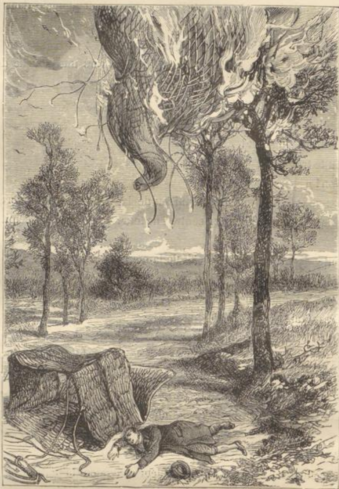
Son ballon s'accrocha à un arbre et sa lampe y mit le feu. (Page 130.)

« Ils étaient perdus ! Les barques épouvantées fuyaient à leur approche !... Heureusement, un navigateur plus instruit les accosta, les hissa à bord, et ils débarquèrent à Ferrada.