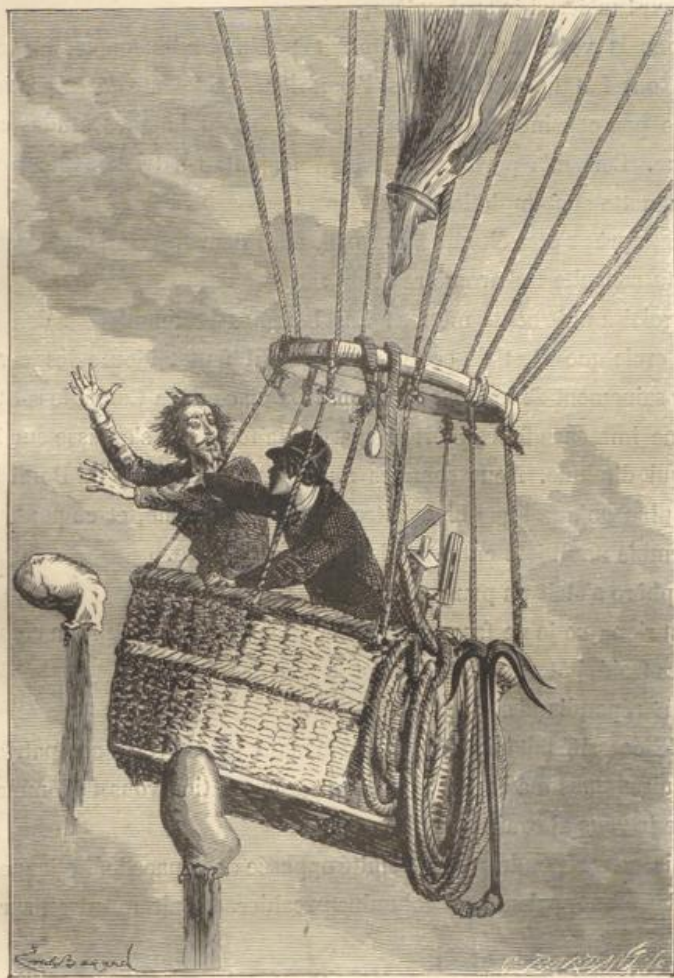
Monsieur ! m'écriai-je en colère. (Page 106.)

Un jeune négociant, nommé Fontaine, escalada la galerie, au risque de faire chavirer la machine !... Il accomplit le voyage, et personne n'en mourut !