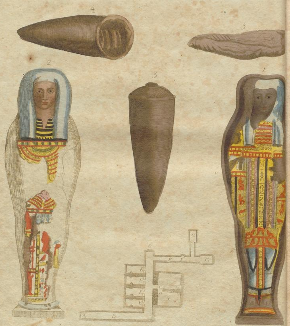
Eigener Anusich zur Fig 1