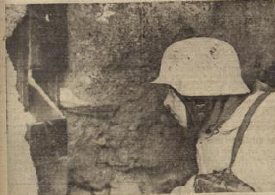
Ein Blick ins Neue Jahr - Am Grabenfeld von Leningrad... Durch den Grabenfeld kann der Porten von Leningrad an geschützter Stelle in vollster Deckung der Stützschiffdivision beobachtet.

Unter dieser Elise kommen dann: 1. die schwer angefertigten Stützschiffdivisionen der Sowjets; 2. die nicht sehr gut ausgebildeten und