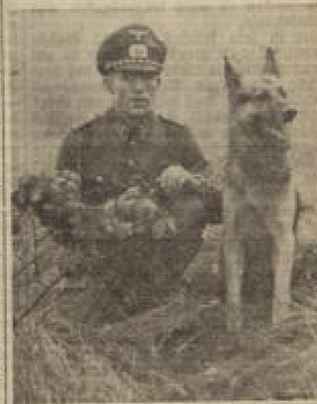
Zollhund „Echo“ wird auf Fahrt gesetzt