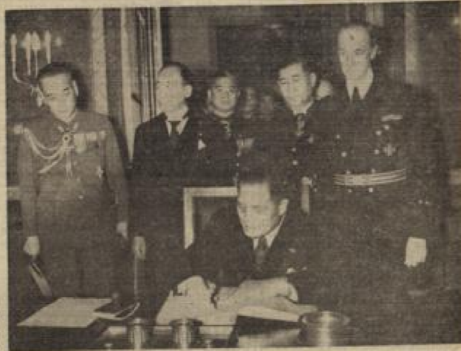
Neujahrsglückwünsche der Diplomaten und der fremden Nationen... Infolge des Krieges fand der alljährliche Neujahrsglückwunsch des diplomatischen Korps nicht statt.

An der tunesischen Front errangen im Laufe des Samstag deutsche Jäger wiederum große Erfolge gegen die feindlichen Luftstreitkräfte.