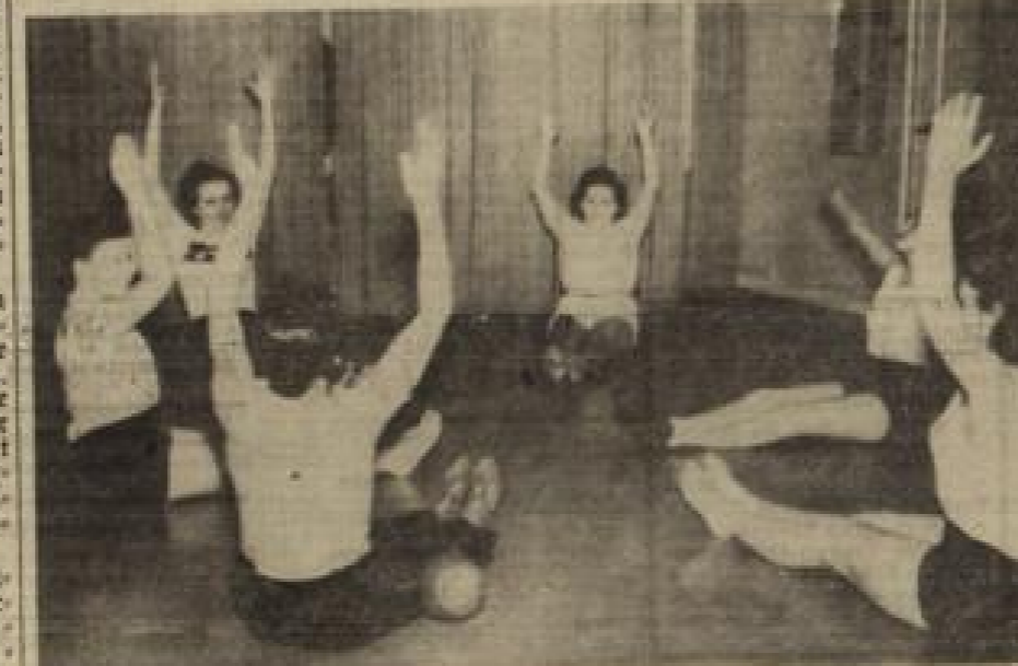
Fünf Jahre BDM-Werk „Globe und Schönheit“ in Freiburg