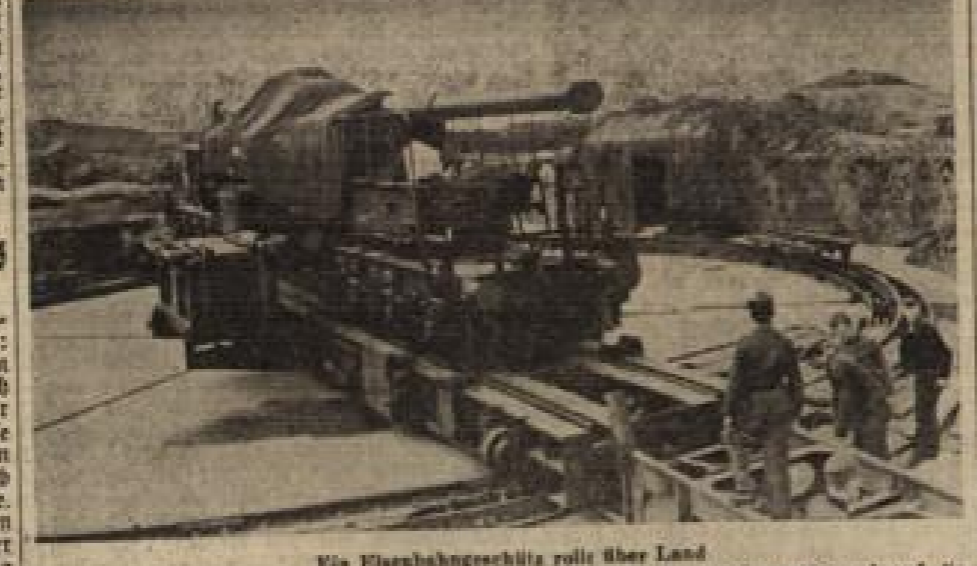
Ein Eisenbahnzug fährt über Land. Das Zehnhundert-Güterzug, auf dem das Eisenbahnmaterial von Laster herunter und auf die Schwesbachs hintransportiert wurde, kann wagenweise sein. Das Geschütz nicht.

Zehnhundert Kräfte der britischen Luftwaffe bombardierten in den letzten Wochen das südliche Gebiet der deutschen Verteidigung. In Nordafrika wurden die eigenen Angriffe der letzten Truppen zusammen. Der Feind verlor hier 14 Panzerkampfwagen.