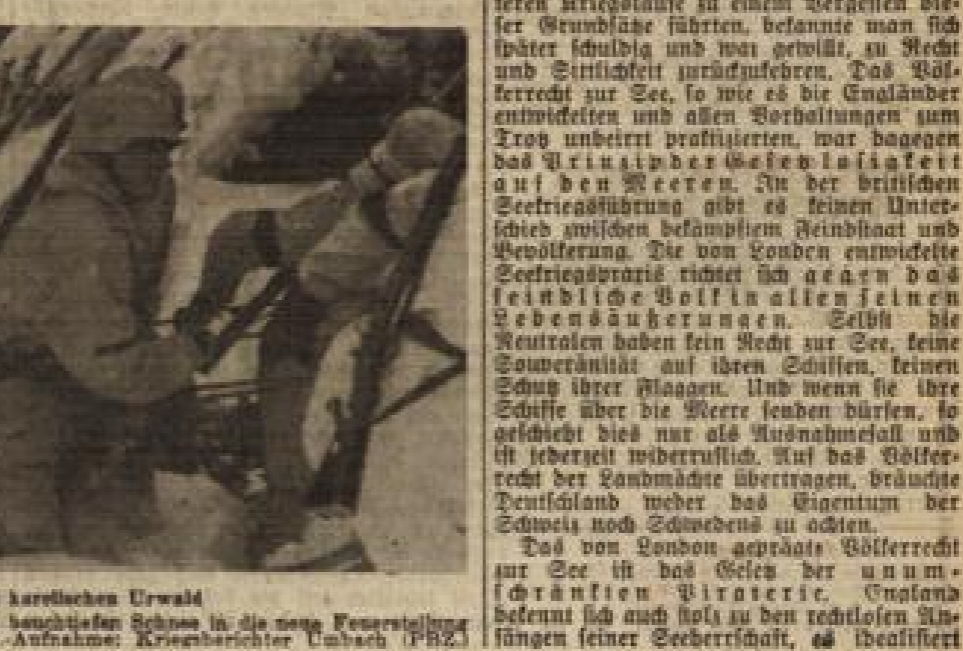
Gebirgsartilleristen im karolischen Urwald... Gebirgsartilleristen im karolischen Urwald...