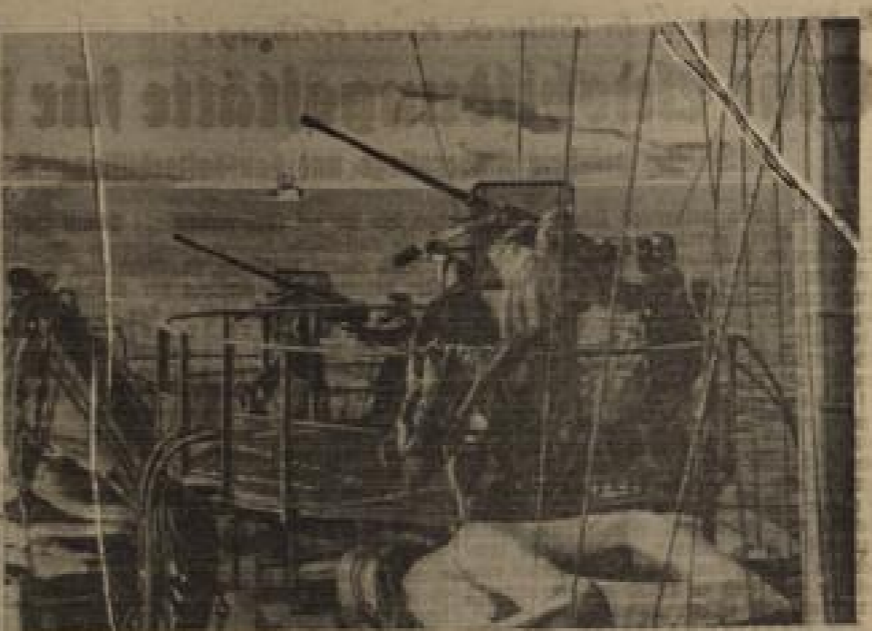
Fliegeralarm an der ostpreussischen Küste. In Sekundenschnelle sind die Abwehrkräfte dieses deutschen Meeresküstenbundes in Alarmbereitschaft. Die Fliegeralarm-Stationen sind durch Funk und Licht miteinander verbunden. (Sch.)

Die Kruppwerke haben durch die Verwendung von Stahlbeton die Lebensdauer der Geschütze verlängert. Die Verwendung von Stahlbeton ermöglichte es, die Geschütze in den Schlachten einzusetzen, ohne sie durch den Beschuss zu zerstören. Die Lebensdauer der Geschütze wurde durch die Verwendung von Stahlbeton verlängert.