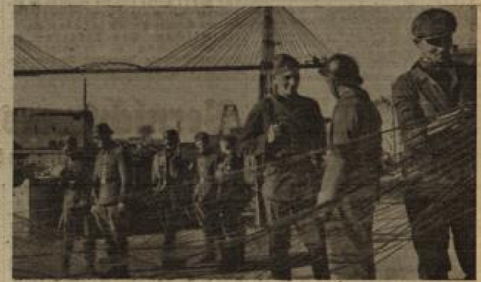
Kriegsschiff des RAD in 804 Frankreich... Arbeiter in Genes mit deutscher Polizei...