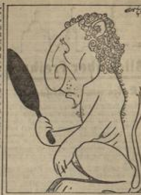
„O alte Britenherrlichkeit...“ „Goddam — ich werde ja immer mehr ein britischer — Löwy!“ Zeichnung von Erik / Hebel.

Da die Menschen immer seltener und teurer werden, hat man in einer Pariser Kirche die Technik in origineller Weise in den Dienst religiöser Gebetsübungen gestellt.