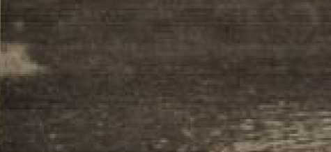
Abraham Lincoln spricht am 27. Januar 1861 vor dem Kongress über die drohende Gefahr durch die sich bildende Konföderation der Südstaaten.