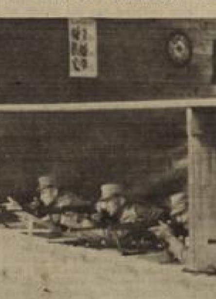
Ausgang der Schießwehrekämpfe 1943 am Sonntag in Freiburg