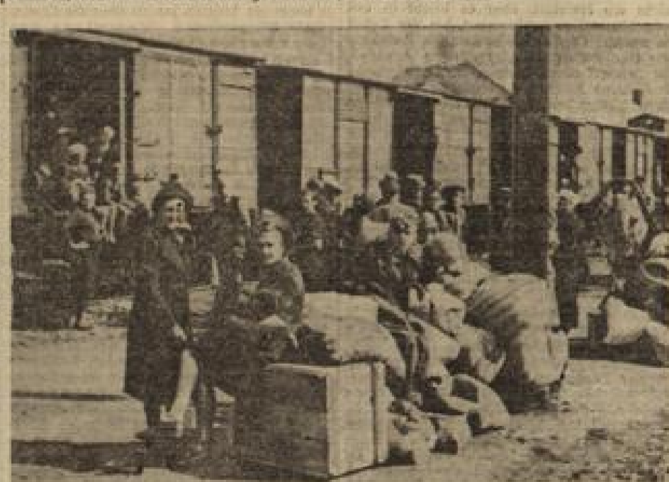
Volksdeutsche gehen mit den deutschen Truppen im Rahmen der planmäßigen Abwehrbewegung...