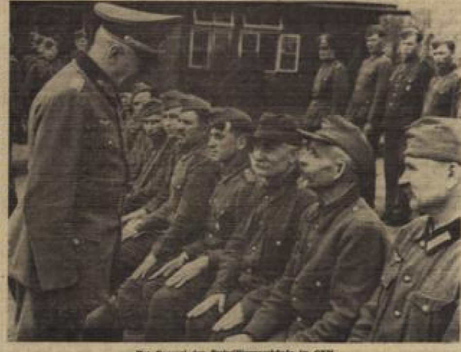
Der General der Freiwilligenverbände im OKW. im Gespräch mit verschiedenen Freiwilligen aus dem Ostfront.