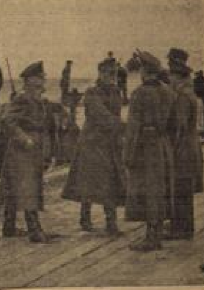
Generaloberst Schöner bei den Verteidigern von Sworbe. Der Oberbefehlshaber einer Heeresgruppe im Osten...