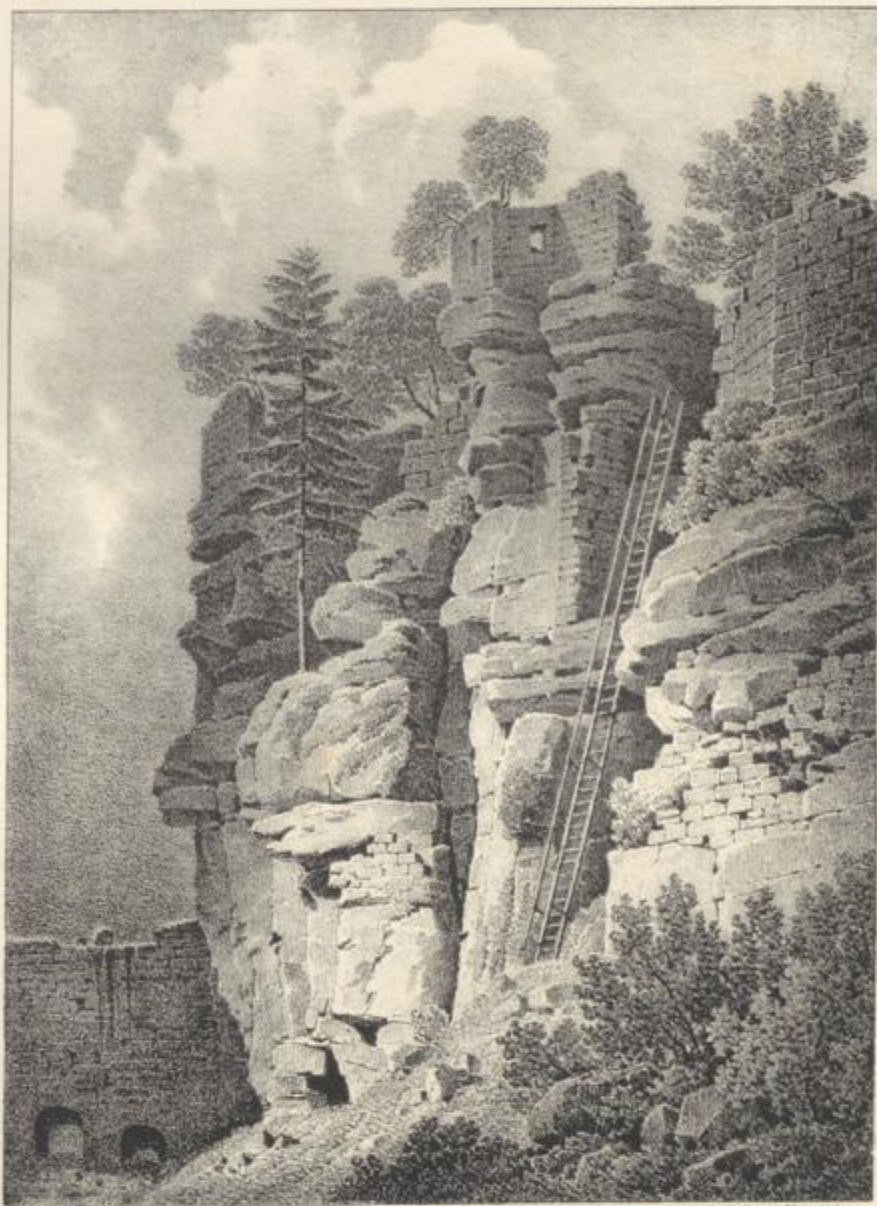
J. Rothmüller del.