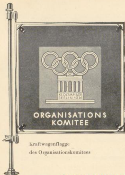
Kraftwagenflagge des Organisationskomitees

DIENSTABZEICHEN: Runde Kunststeinplakette mit eingelassenem offiziellen Abzeichen (wie die nichtoffiziellen Abzeichen):