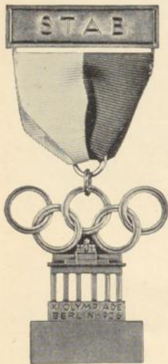
*) Olympisches Band: Blau-Gelb-Schwarz-Grün-Rot