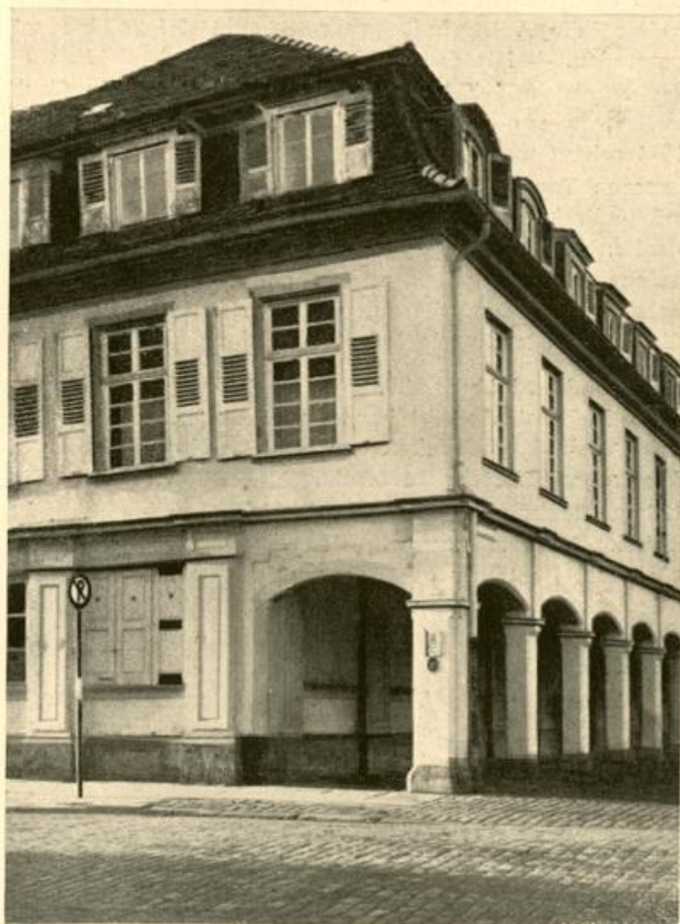
Früheres Modelsches Haus, Schloßplatz 20

Die Herrennamen blieben nicht allzulange an den Straßen haften. Es ist nicht ersichtlich, warum sie mehrfach geändert oder umgestellt worden sind. Vermutlich hat da die höfische Rangordnung mitgesprochen. 1737 war die Plantische Gasse an die Stelle der Rotbergischen (jetzt Waldstraße), die bisher Rotbergische an den Platz der Löwencronischen gerückt worden. Ihr folgten nun ostwärts die Drais'sche, die Graf Leiningen'sche und