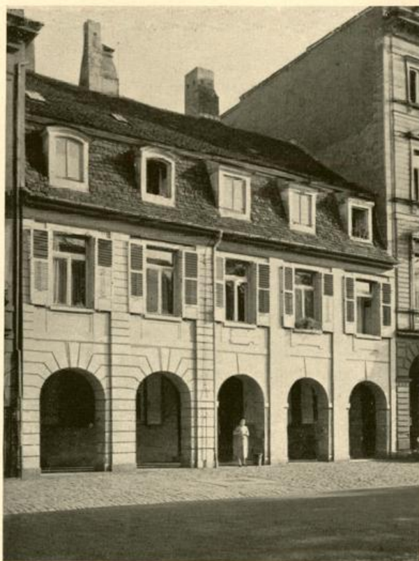
Klopstock-Haus, Schloßplatz 9