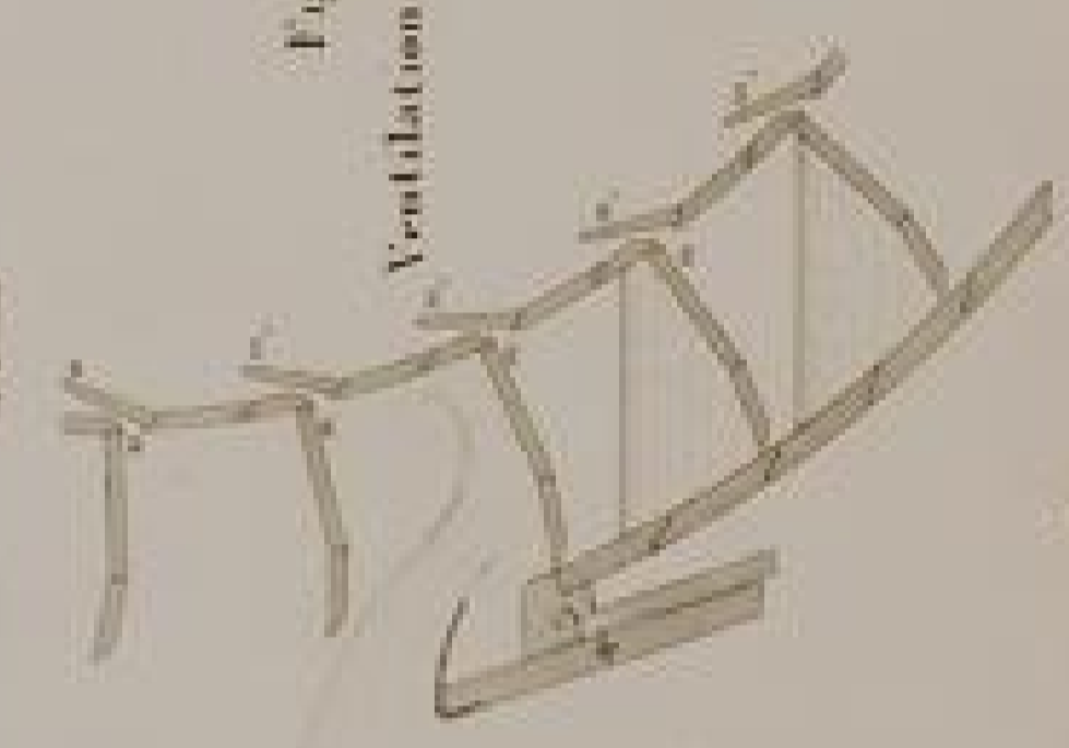
Fig. 3 Ventilation des Rades