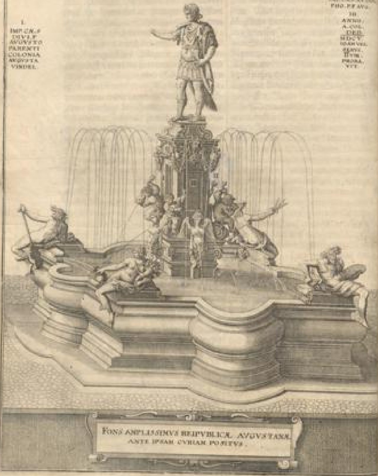
FONS ANPLESSIVS REPUBLICAE AVGVSTANAE ANTE IPAM CIVITATEM POSITVS.

II. POMPEI ANNO A. D. MDCX. III. ANNO A. D. MDCX. IV. ANNO A. D. MDCX.