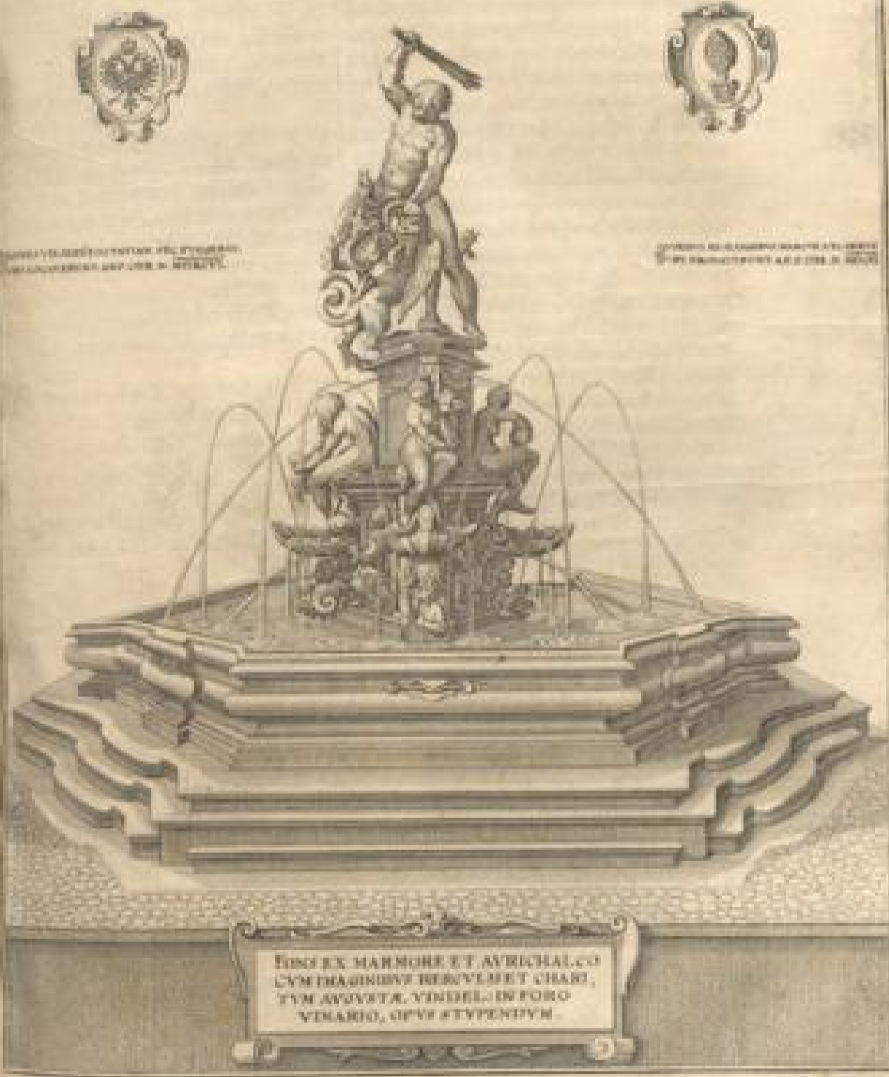
Abbildung des Schönen, von Marmor und Metall, künstlich verfertigten Brunnens, auff dem Weinmarkt zu Augsburg.