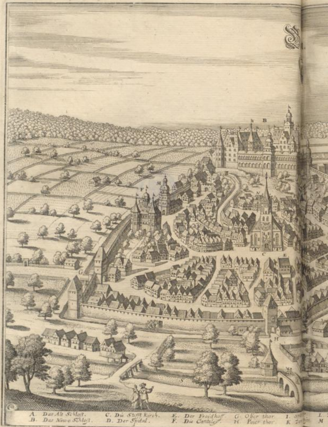
A. Das Alt Schloß. C. Die Stoff Kirch. E. Der Froidhoff G. Ober thor. I. ... L. ... B. Das Neue Schloß. D. Der Spital. F. Die Cantley. H. Vier thor. K. ... M. ...