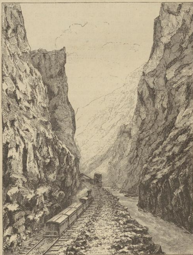
Eisenbahn im Großen Arkansas = Cañon.

hinaufreicht. Unter der außerordentlich bunten Bevölkerung Kaliforniens bilden die Chinesen ein zahlreiches aber keineswegs beliebtes Element. Die wichtigste Stadt des Landes, die „Königin des Stillen Meeres“, ist San Francisco (300 000 Einwohner), am westlichen Ende der gleichnamigen schmalen Bai. Im Jahre 1836 stand an Stelle der Stadt nur ein einfaches Haus. Erst die Ent-