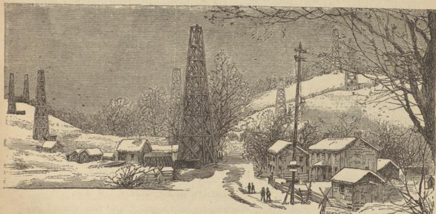
Eine Ölfeldstadt in Pennsylvanien.

gehört zu den fruchtbarsten und reichsten Ländern der Union. Von größter Bedeutung sind die unerschöpflichen Kohlenlager, in deren Mittelpunkt die gewaltige Fabrikstadt Pittsburg emporblühte.