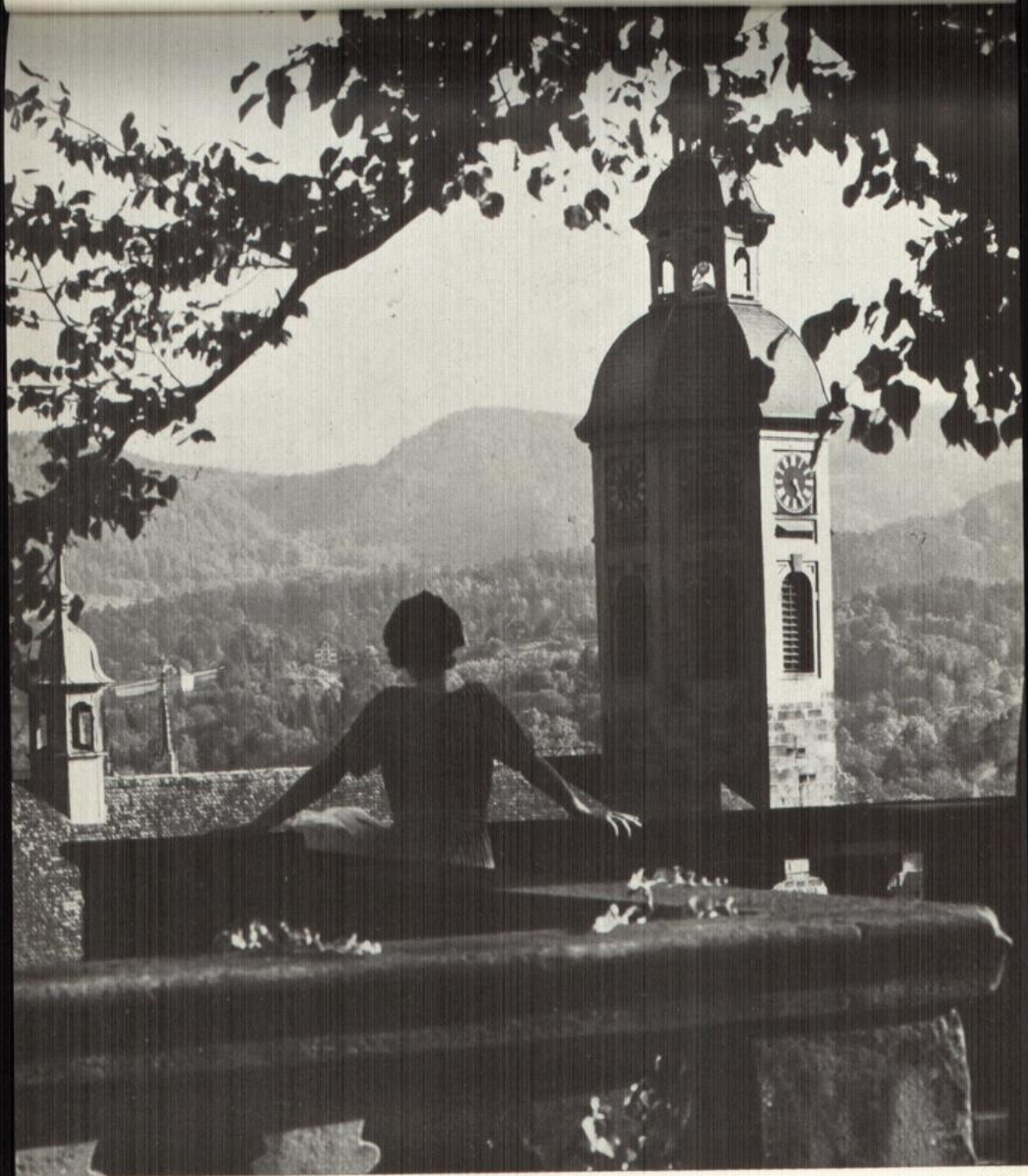
Rufnahme Rein Gorny, Berlin

24 Montag Generalfeldmarschall Graf Helmuth v. Moltke † 1891 SR. 5.20 — SU. 19.30