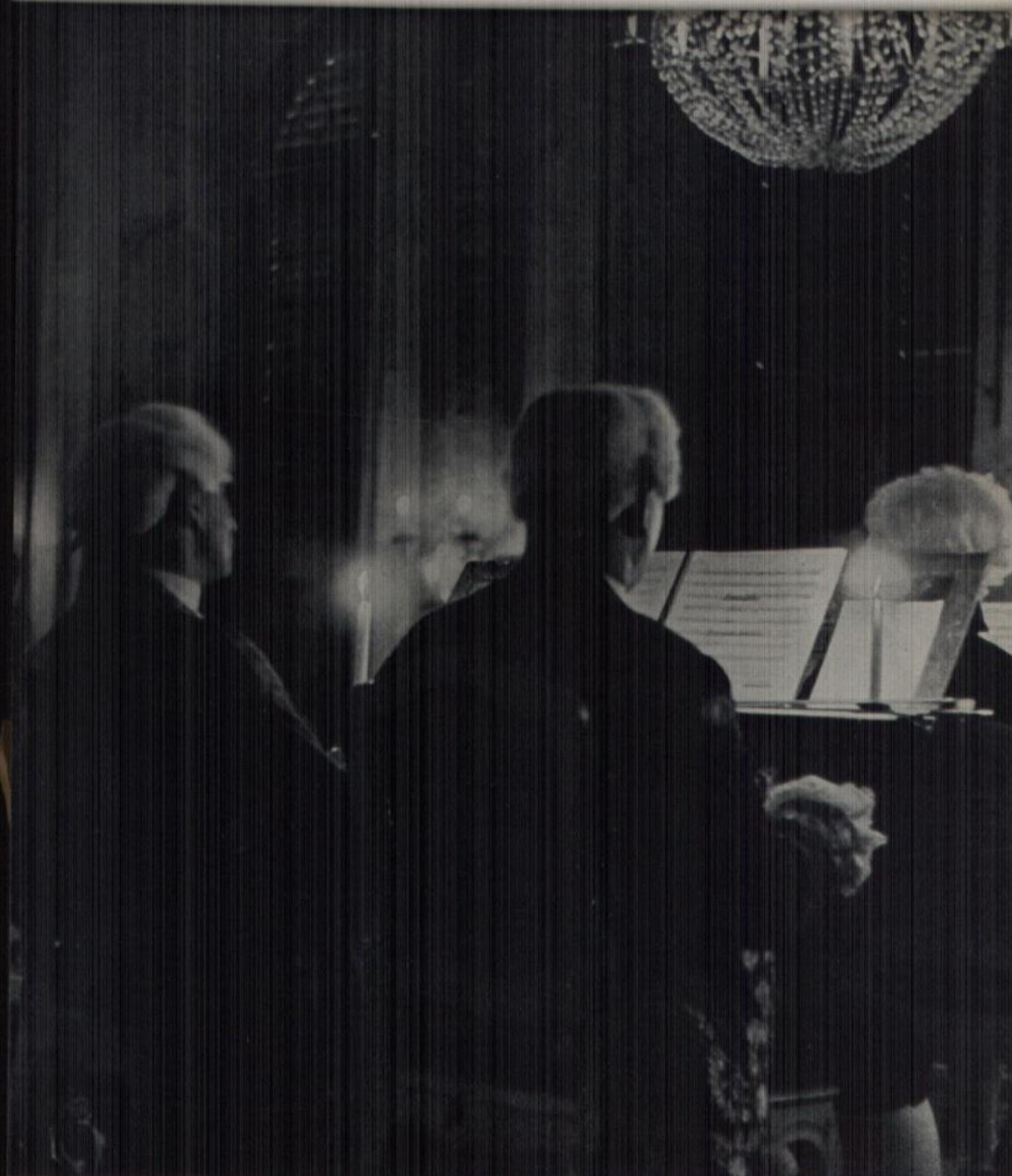
Aufnahme E. Bauer, Karlsruhe