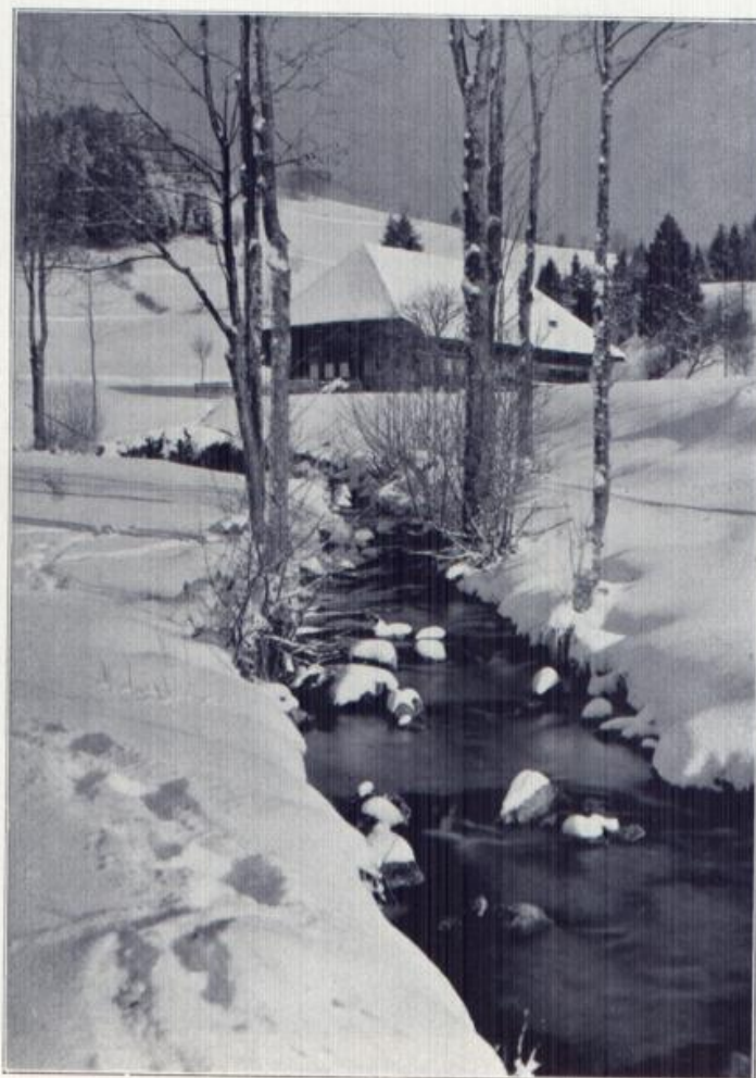
Winteridyll im Schwarzwald.