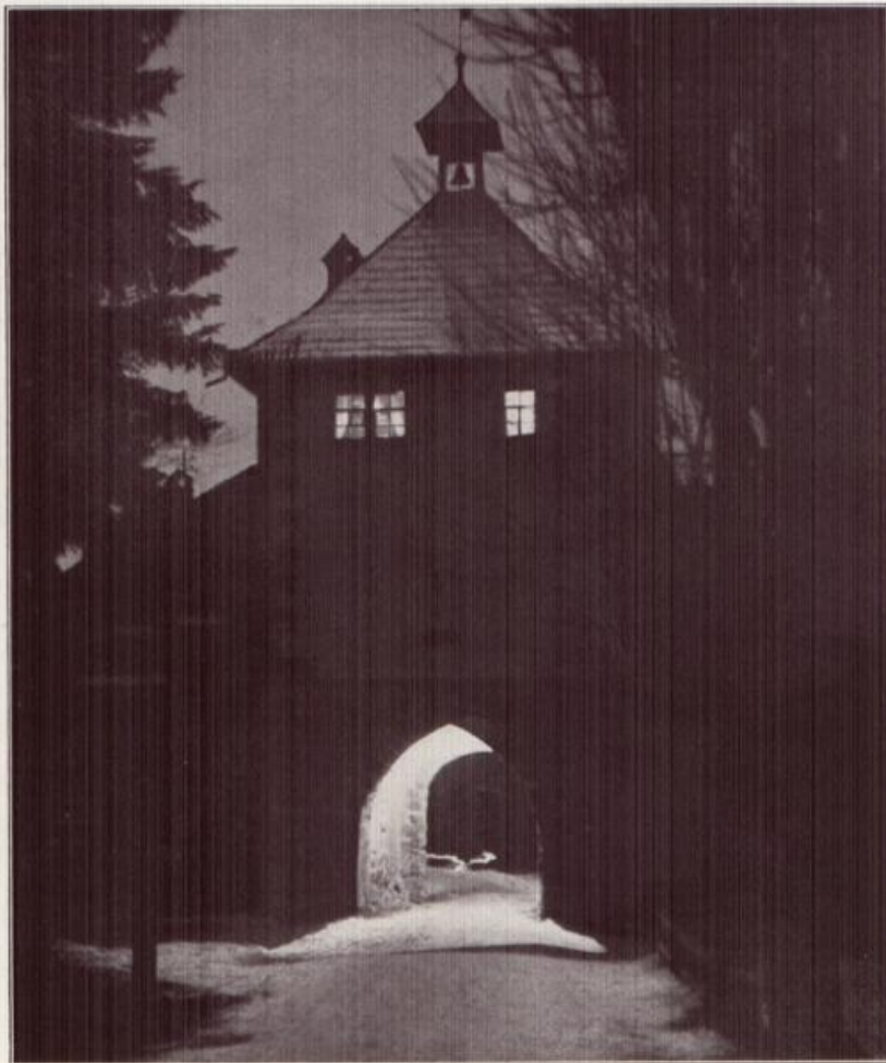
Eylvesterpöesie in Überlingen.