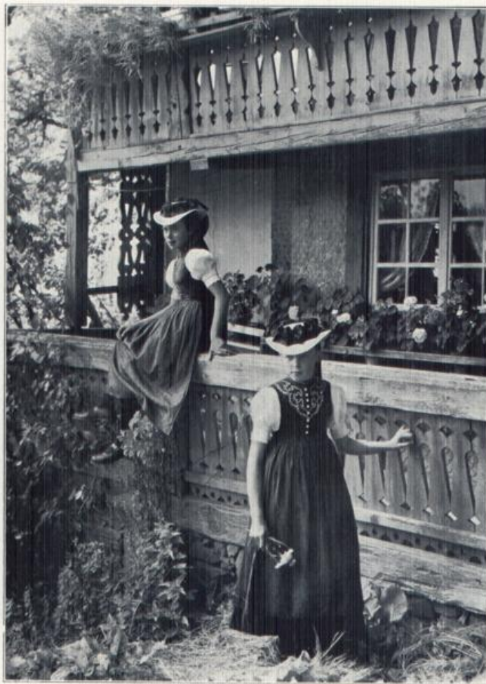
Ein Blumenruß aus dem Schwarzwald.

Freundlich wie der Schwarzwald sind auch seine Bewohner, die dem fremden Wanderer mit ihrem freundlichen „Grüß Gott“ der lieblichste Wegweiser durch das schöne Wald- und Wandergebirge sind.