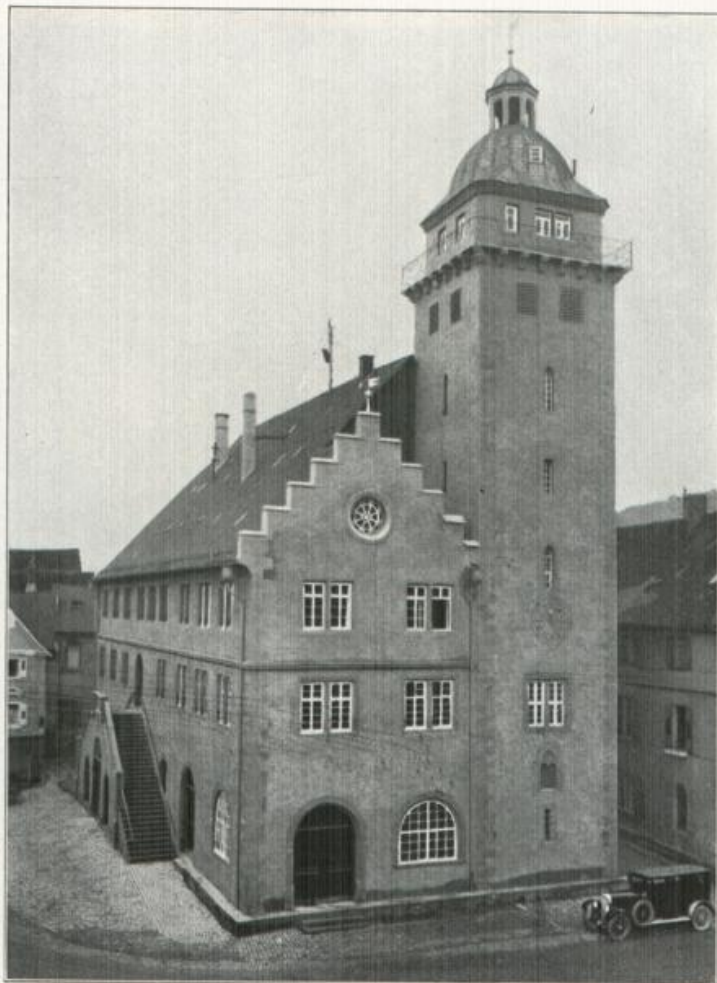
Das Rathaus in Mosbach

Ist die bauliche Krönung des an köstlichen mittelalterlichen Waldern reichen Städtchens zwischen Heidelberg und Würzburg.