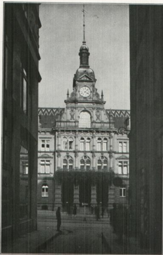
Das Pforzheimer Rathaus

erhebt sich stolz und selbstbewußt über dem alten Marktplatz. Die viertgrößte Stadt Badens, die „Pforte des Schwarzwaldes“, wo die berühmten Höhenwege ihren nördlichen Ausgang nehmen, beherrscht Pforzheim mit seiner Goldwarenindustrie den Weltmarkt. Pforzheim ist Hauptstation der Eisenbahnlinie Karlsruhe—Stuttgart und Ausgangspunkt der Bahnen nach Wildbad und Calw—Horb.