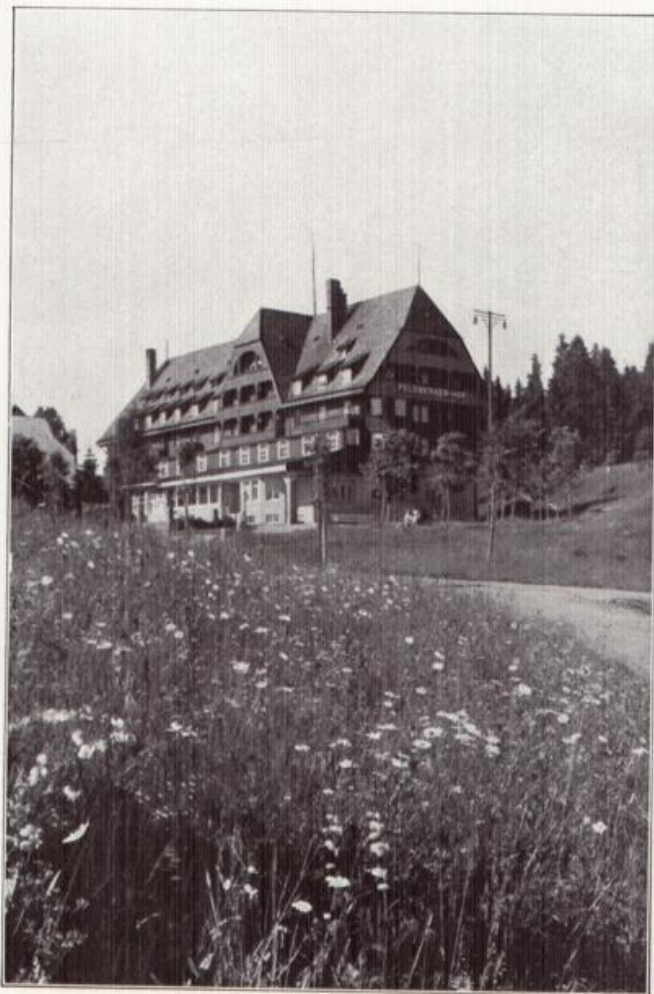
Der Feldberger Hof,

einst eine einfache Kaffst tte f r den Bergwanderer, ist heute Kur- und Sporthotel ersten Ranges — vor allem im Winter ist der Feldberger Hof die Hochburg des deutschen Skisports, der hier sportlich und gesellschaftlich seine feste Verankerung hat.