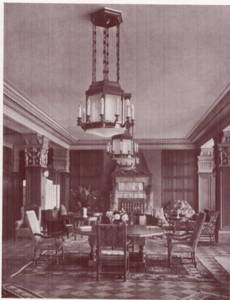
Die Halle im Sanatorium Glotterbad.

„Für die Pflege einer vornehmen Geselligkeit können in einem Sanatorium nicht leicht behaglich-elegantere, mit soviel geschmackvoller Innenausstattung ausgestattete Gesellschaftsräume zur Verfügung gestellt werden, als dies im Glotterbad der Fall ist.“