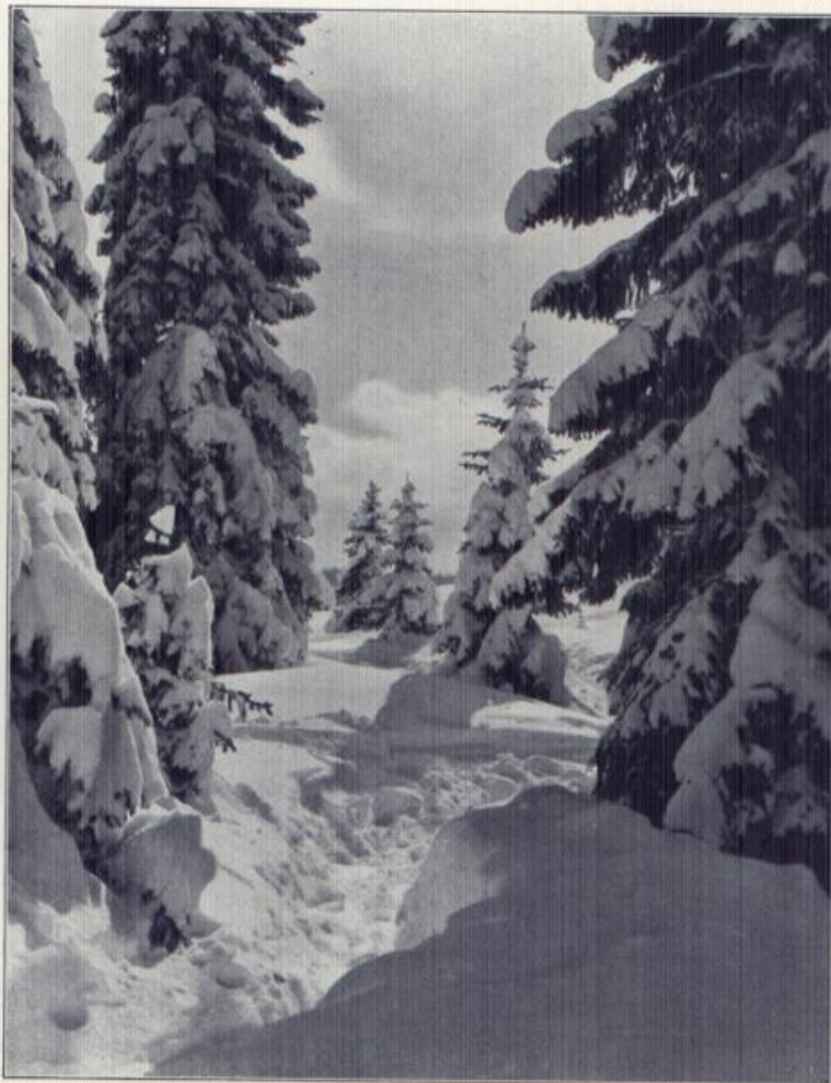
Winterwald bei Hinterzarten.

Einer der beliebtesten Wintersportplätze ist Hinterzarten an der Höllentalbahn. Drächtige Stiefelder, wundervoller Winterwald, Tourenmöglichkeit nach allen Seiten, dazu eine vorzügliche Unterkunft rechtfertigen den guten Ruf Hinterzartens als Winterkurort.