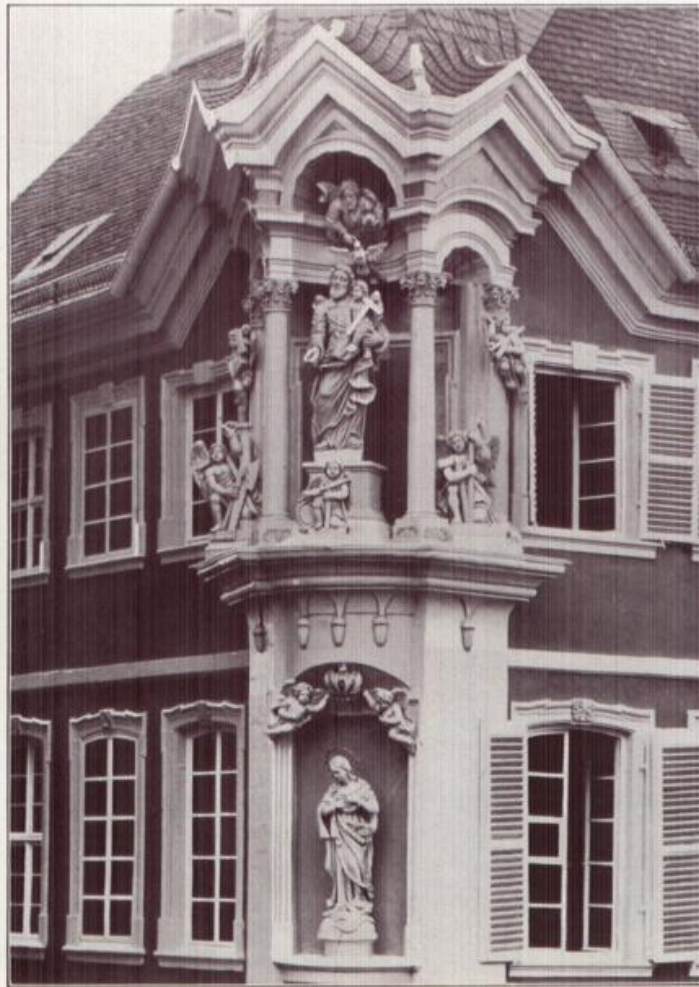
Das prächtige Mannheim.

So schöne Erker- und Nischenfiguren (am Hause B 4, 1) kann man in Mannheim viele sehen als Zeugen dafür, daß Mannheim nicht allein Industrie- und Handelsstadt, sondern daß die oberrheinische Wirtschaftsmetropole auch eine lebenswerte Kunststadt ist.